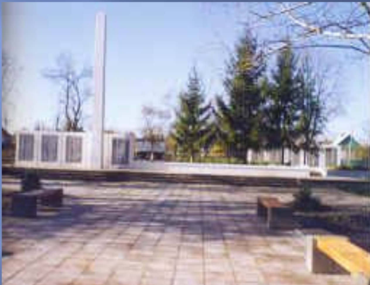
Станица Махошевская Мостовского района Краснодарского края. Братская могила 207 жителей поселка Михизеева Поляна.