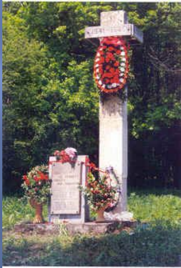
Памятник на месте бывшего поселка Михизеева Поляна.