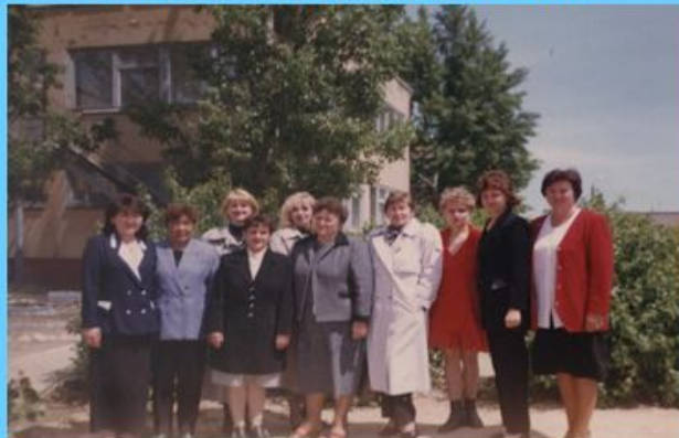
Группа учителей лицея №1 у нас на семинаре - практикуме

Семинар в инженерно – техническом лицее № 1 г. Волгограда по теме: «Технология УДЕ на уроках математики в начальной школе»