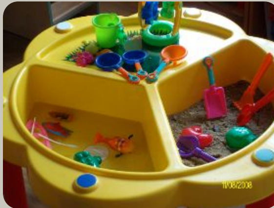
Дидактический стол для игр с песком и водой