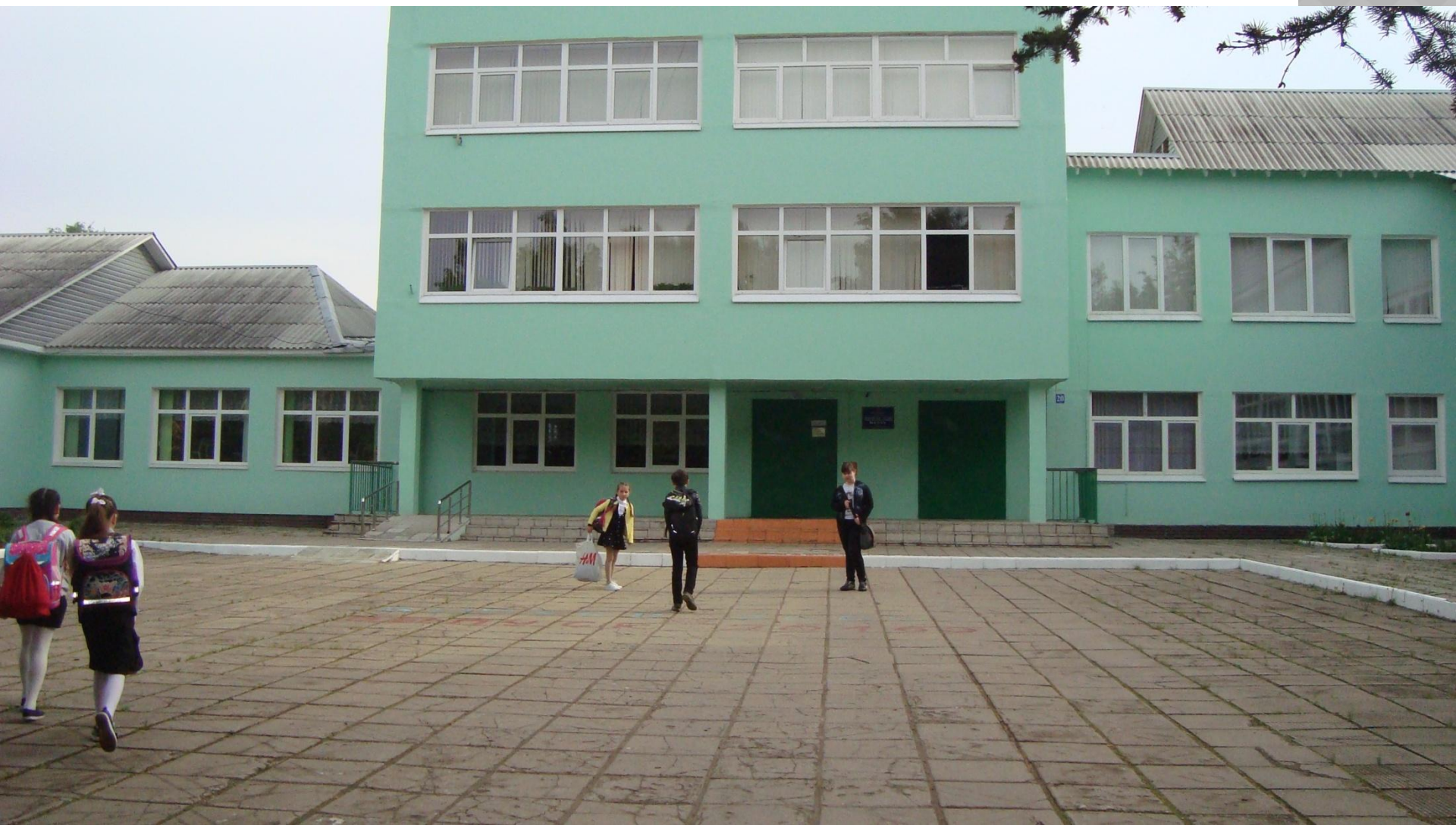
Наша любимая школа. МОУ «Ивановская СОШ»