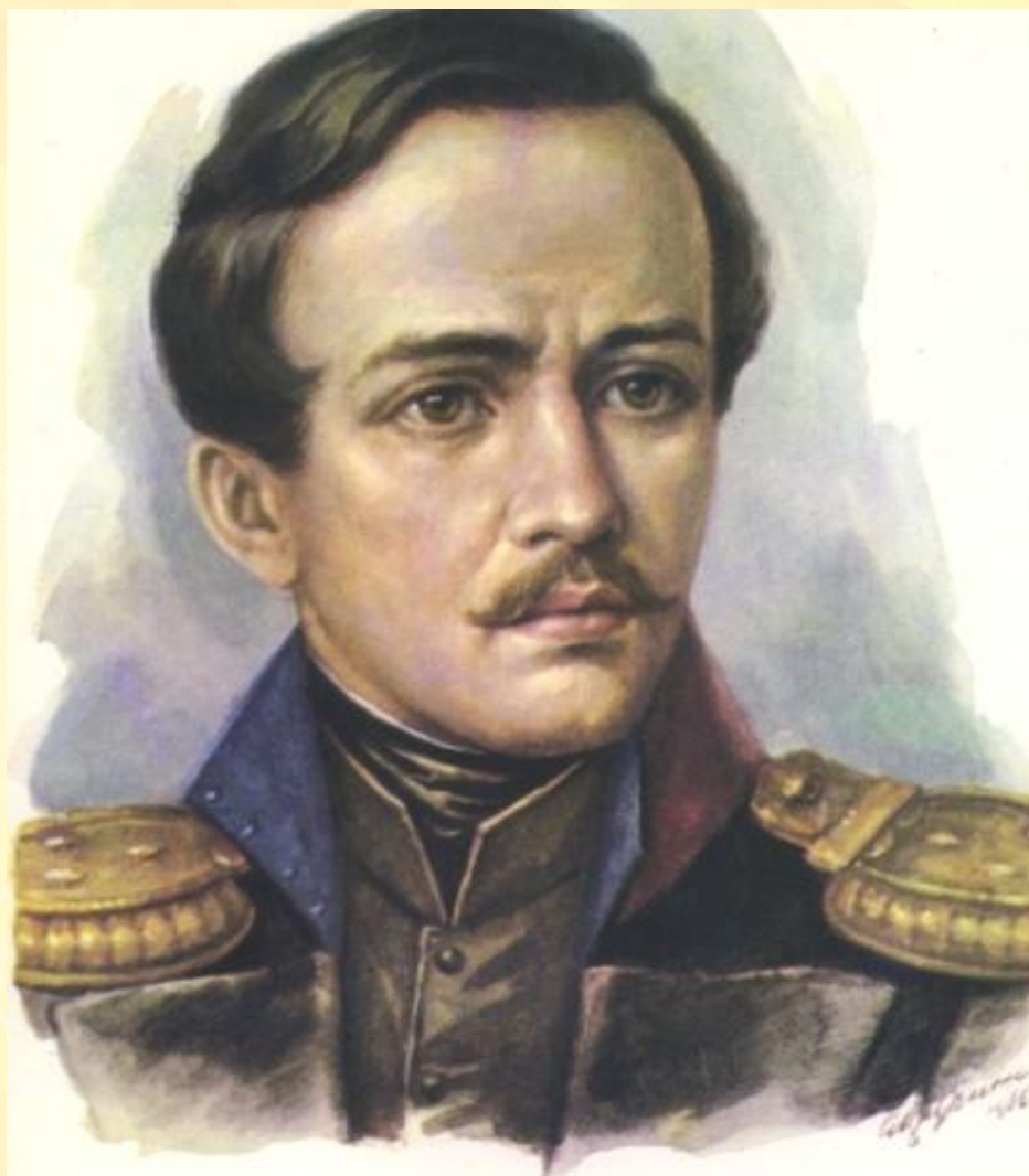
Михаил Юрьевич Лермонтов (1814—1841)