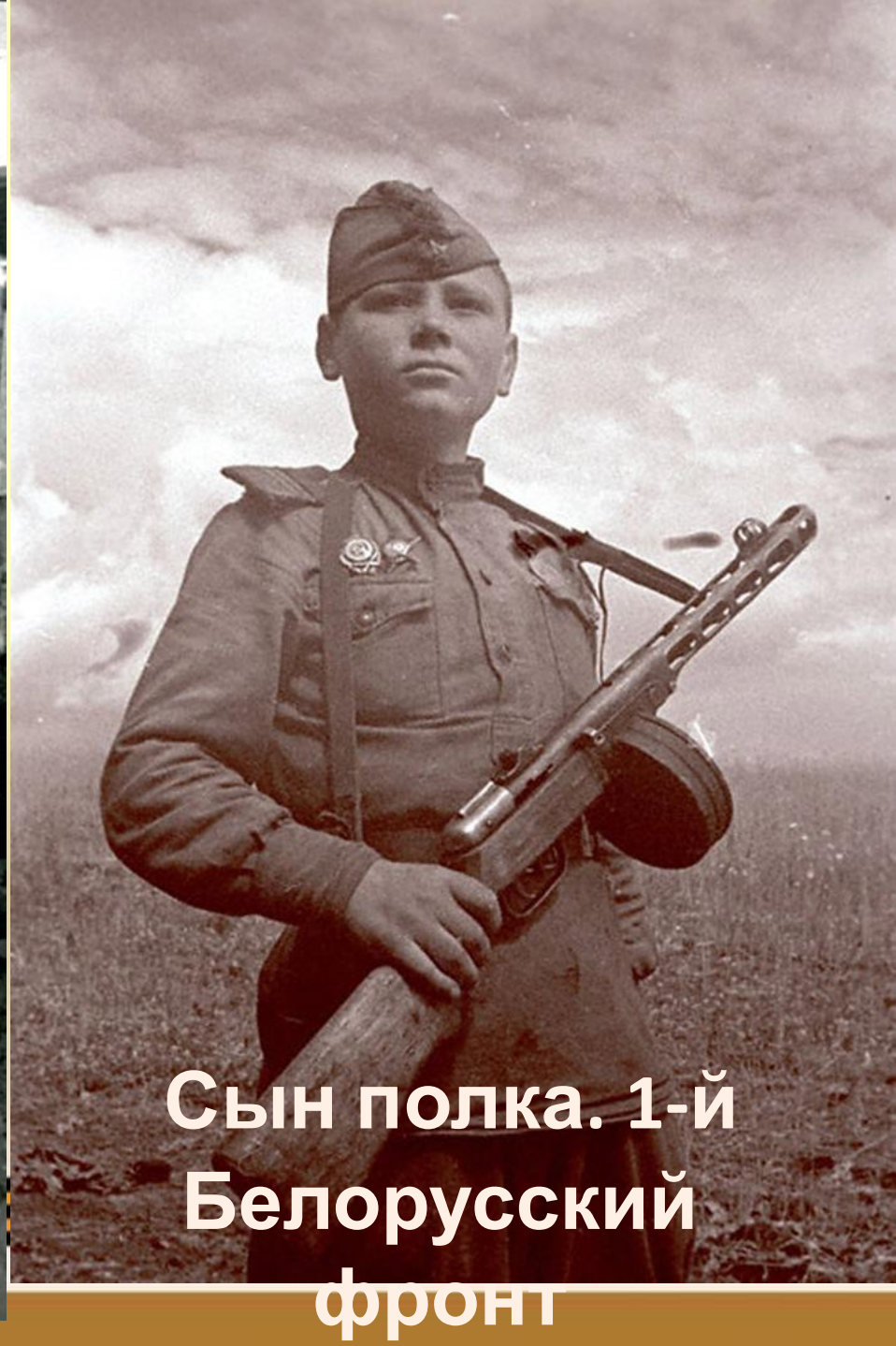
Сын полка. 1-й Белорусский фронт