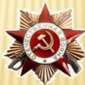
Орден Отечественной Войны 1 степени