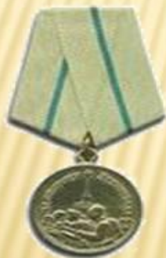
Медаль «За оборону Ленинграда »