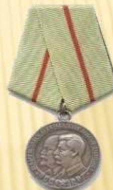
Медаль «Партизану Отечественно й Войны 1 степени»