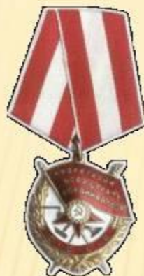
Орден Боевого Красного знамени