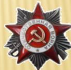
Орден Отечественной Войны 2 степени