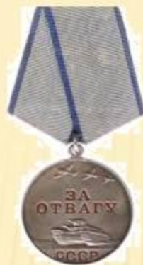
Медаль «За отвагу»