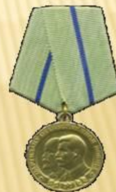
Медаль «Партизану Отечественно й Войны 2 степени»