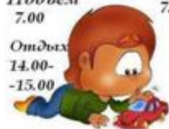
Отдых 14.00- -15.00