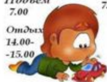
Отдых 14.00- -15.00