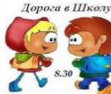
Дорога в Школу 8.30