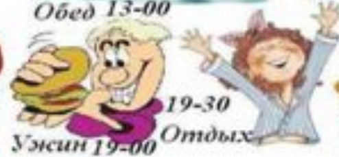
Ужин 19-00 Отдых 19-30