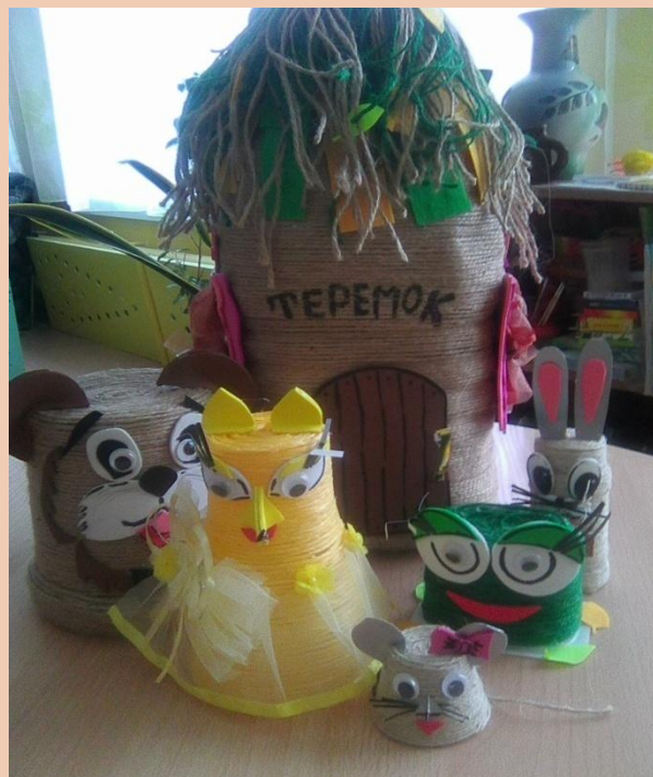
Театр своими руками

Участие в театрализованных играх способствует общению детей со сверстниками и взрослыми, доставляет детям радость, вызывает активный интерес к игре.