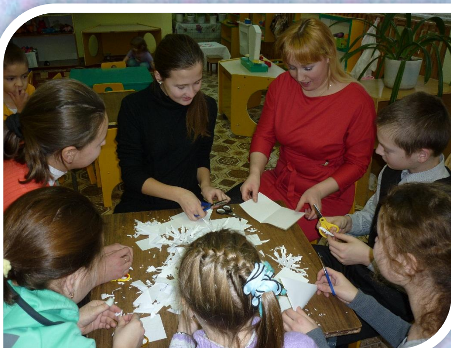
Помощь школьников детскому саду