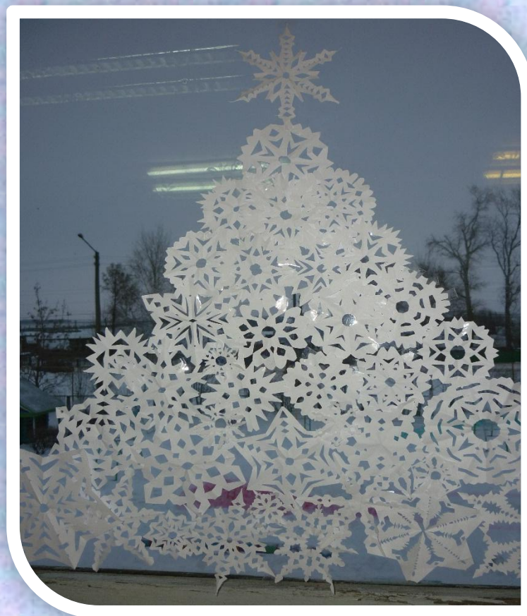
Вот и наша ёлочка