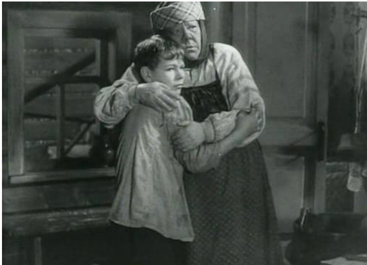
Кадр из х/ф «Детство»