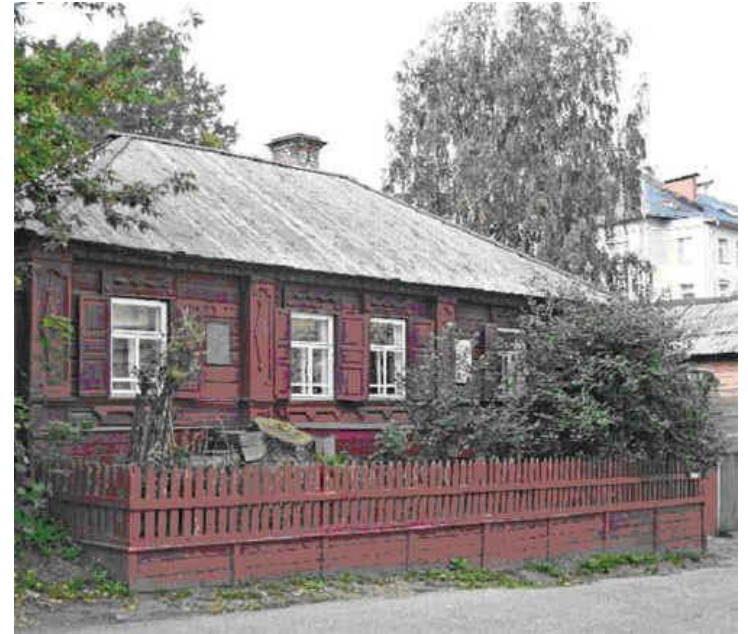
Дом-музей деда Каширина.