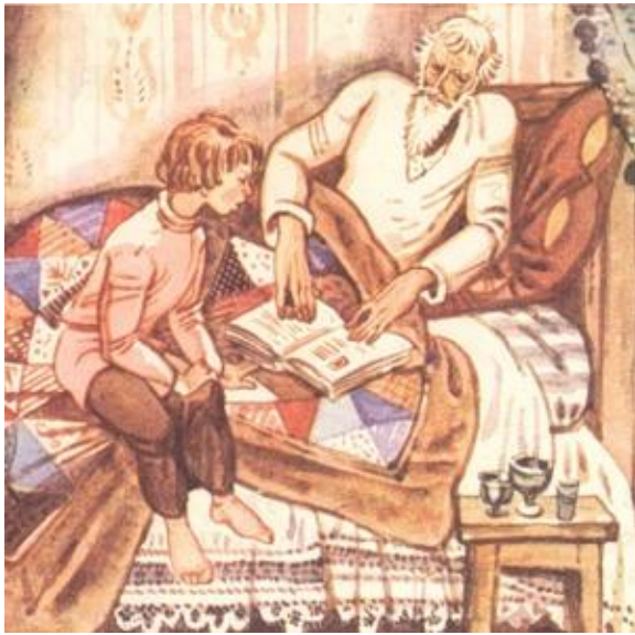
Иллюстрация к книге «Детство»