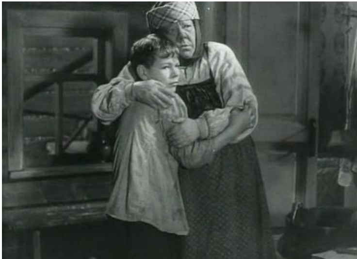
Кадр из х/ф «Детство»