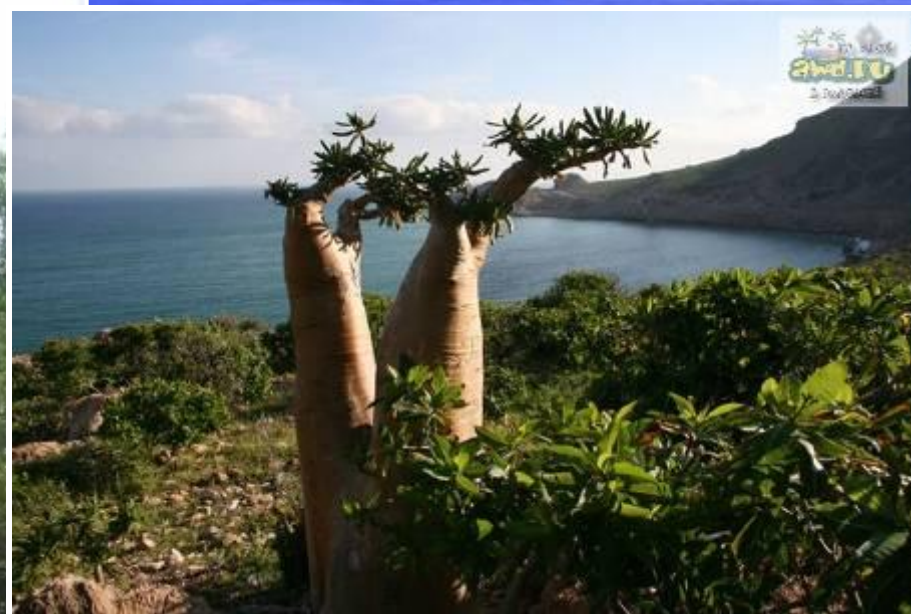
Бутылочное дерево — пахира водная