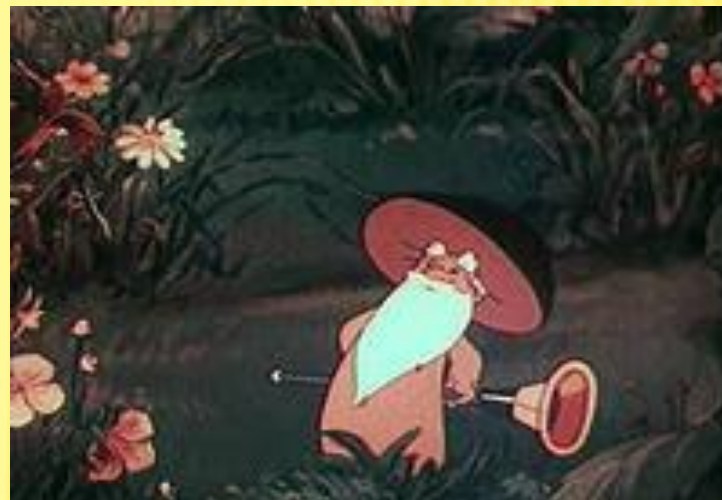
«Дудочка и кувшинчик»