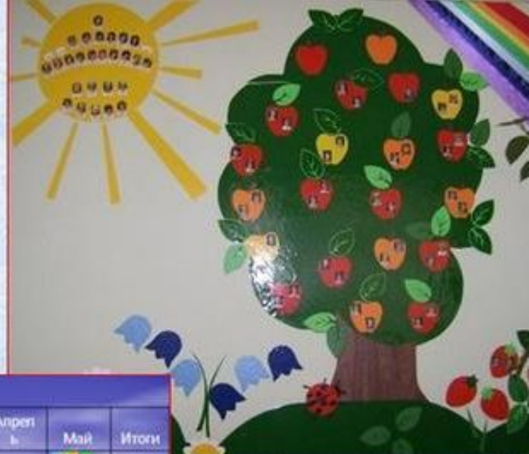
Панорама добрых дел