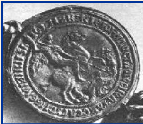
Печать Ивана III