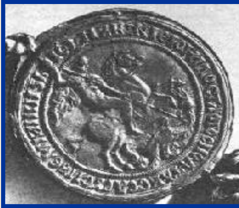
Печать Ивана III