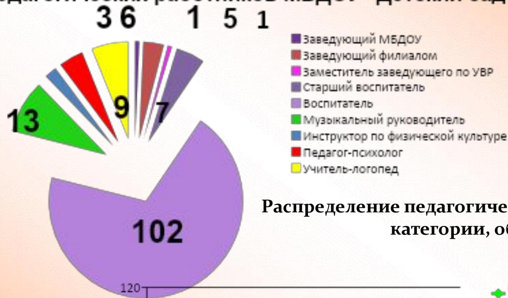
Распределение педагогических работников по стажу, категории, образованию

Штат педагогических работников МБДОУ "Детский сад № 43"