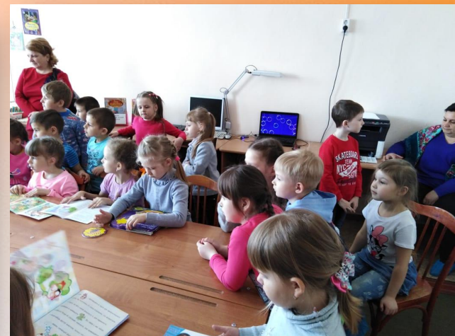
Экскурсия воспитанников в МБОУ СОШ № 15