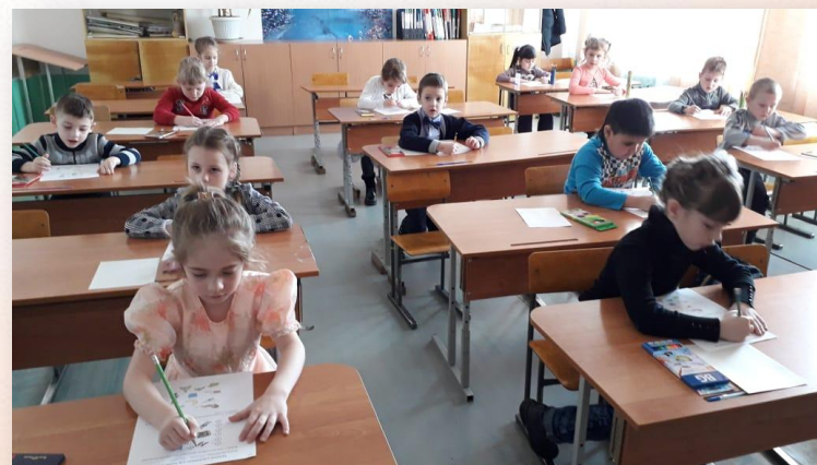
Участие детей подготовительных групп в олимпиаде ШО №1 в МБОУ «Лицей № 17»