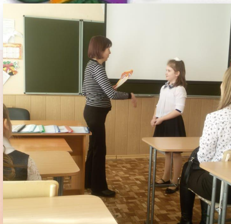
Выпускники 2016 года, обучающиеся в МБОУ СОШ № 15