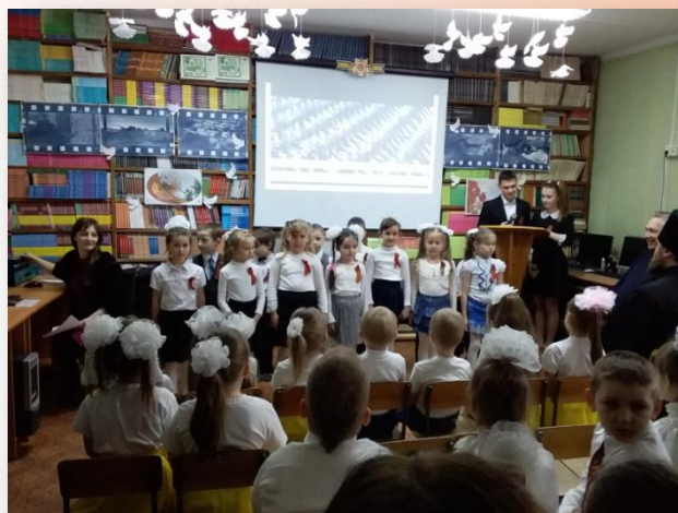
Выступление детей подготовительной группы на мероприятии «День Победы» в МБОУ «Лицей № 17»