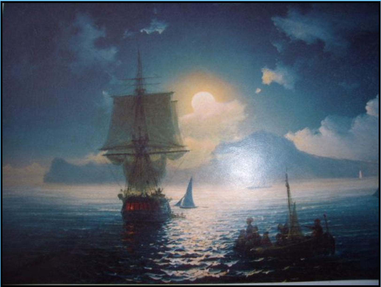
И. Айвазовский «Лунная ночь на Капри»