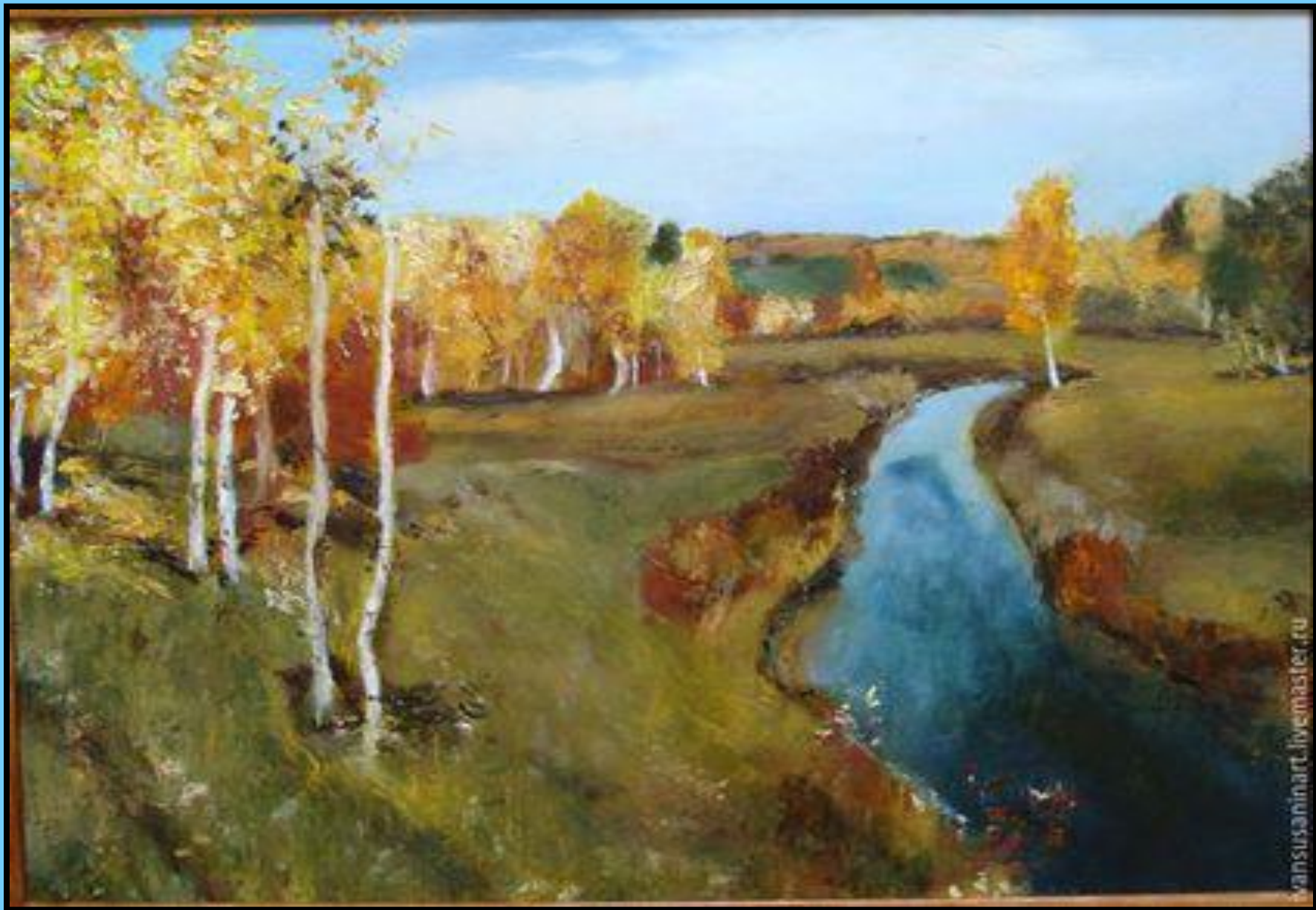
И. Левитан «Золотая осень»