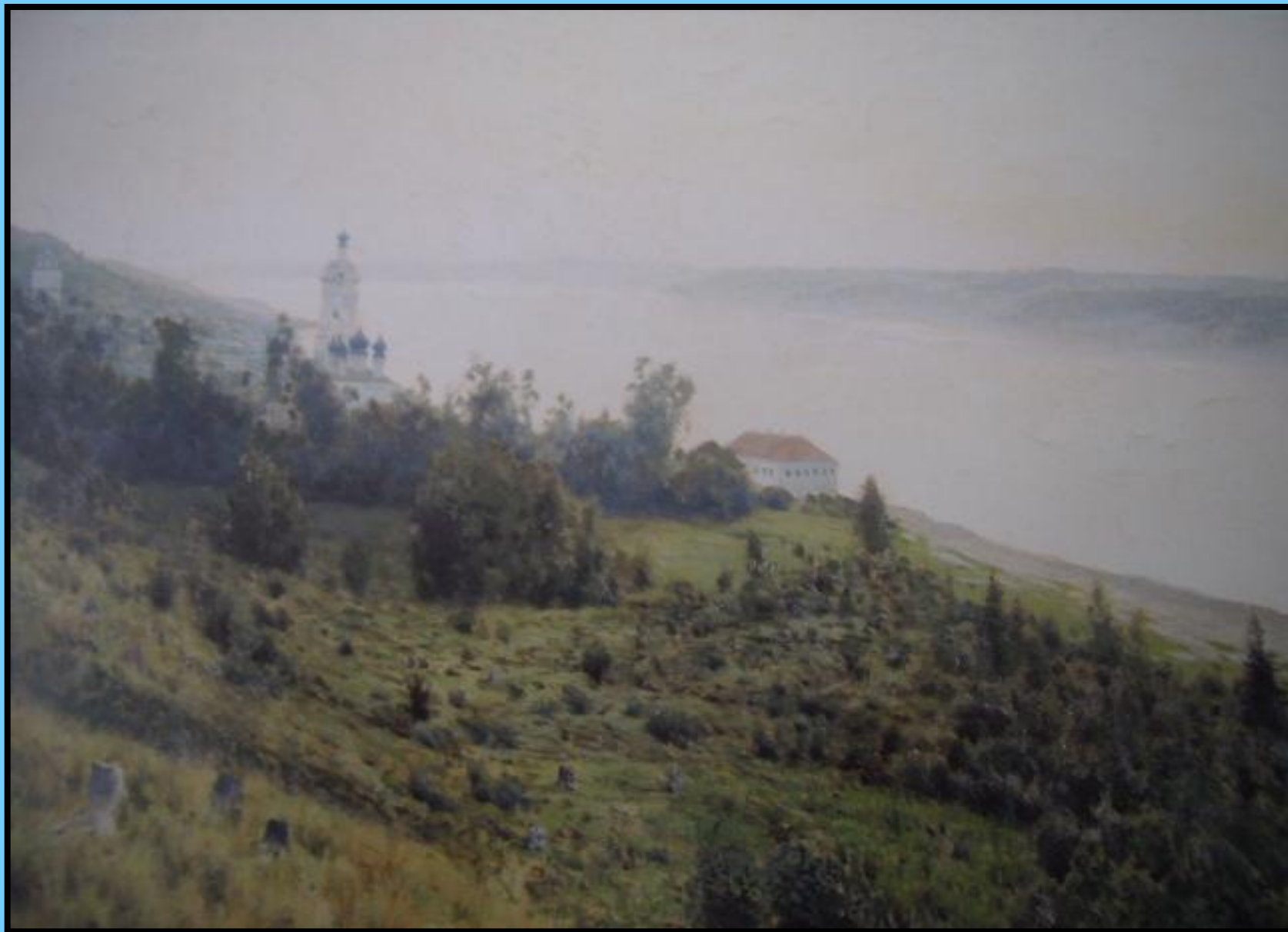
И.Левитан «Вечер. Золотой плес»