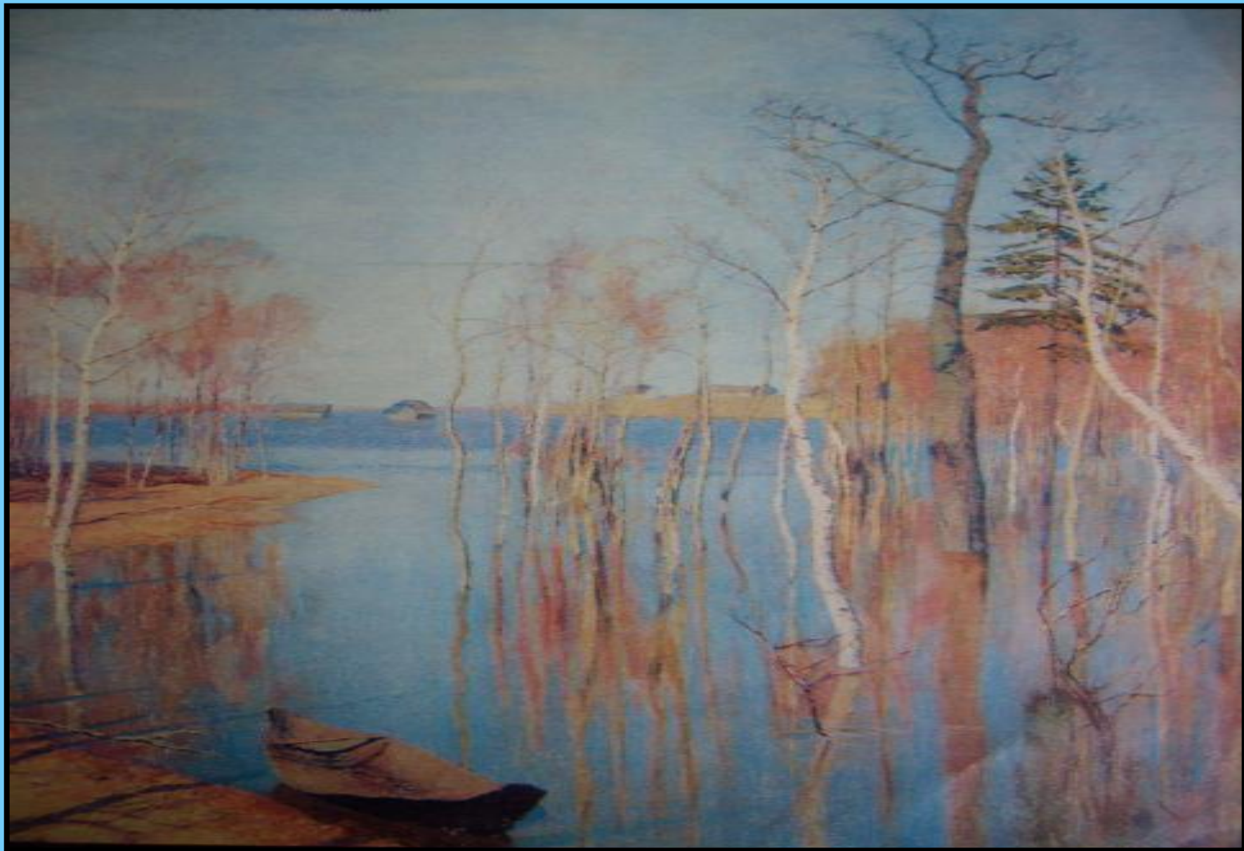
И.Левитан «Весна – большая вода»