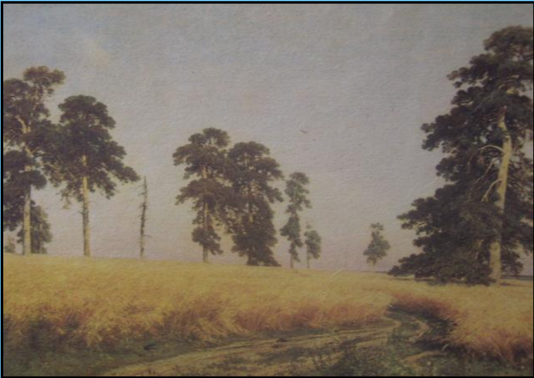
И.И. Шишкин «Рождь»