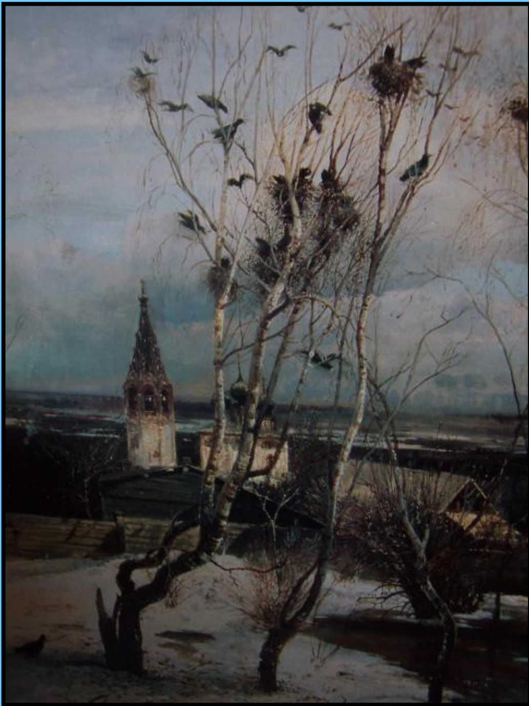
А.Саврасов «Грачи прилетели»