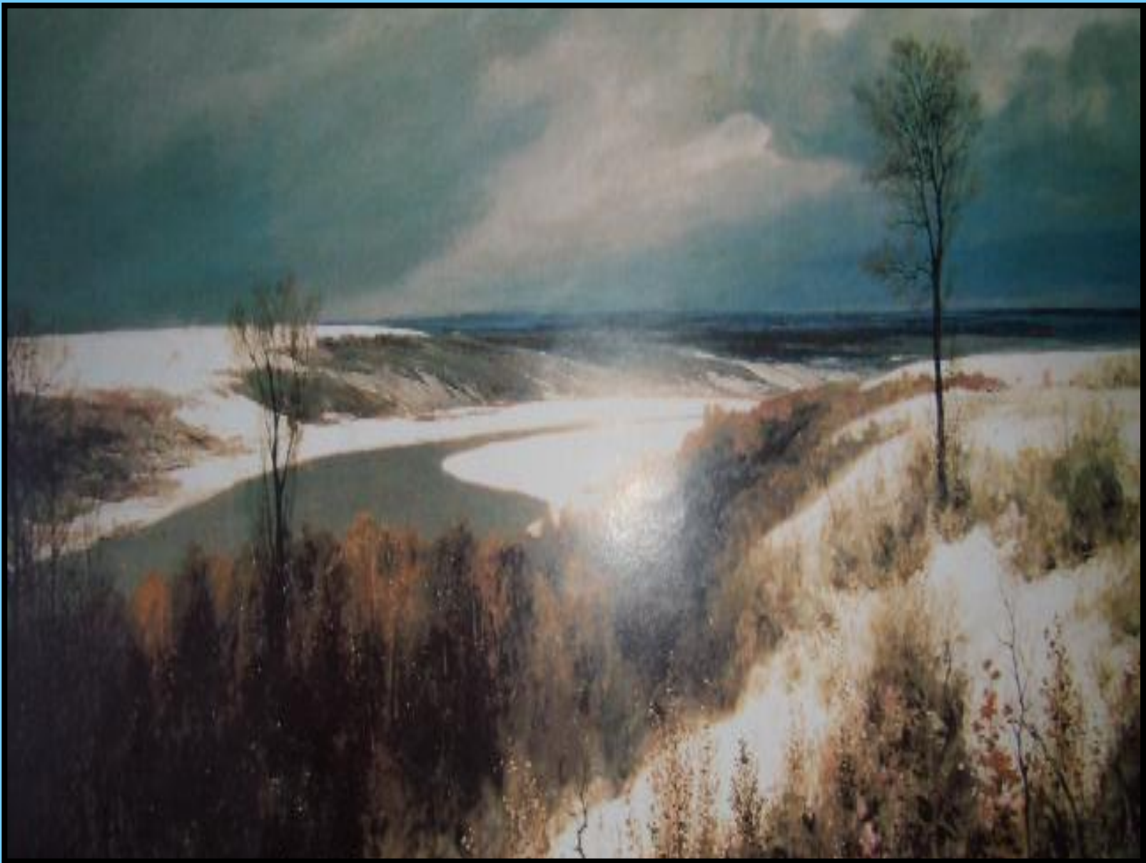
В.Д. Поленов «Ранний снег»