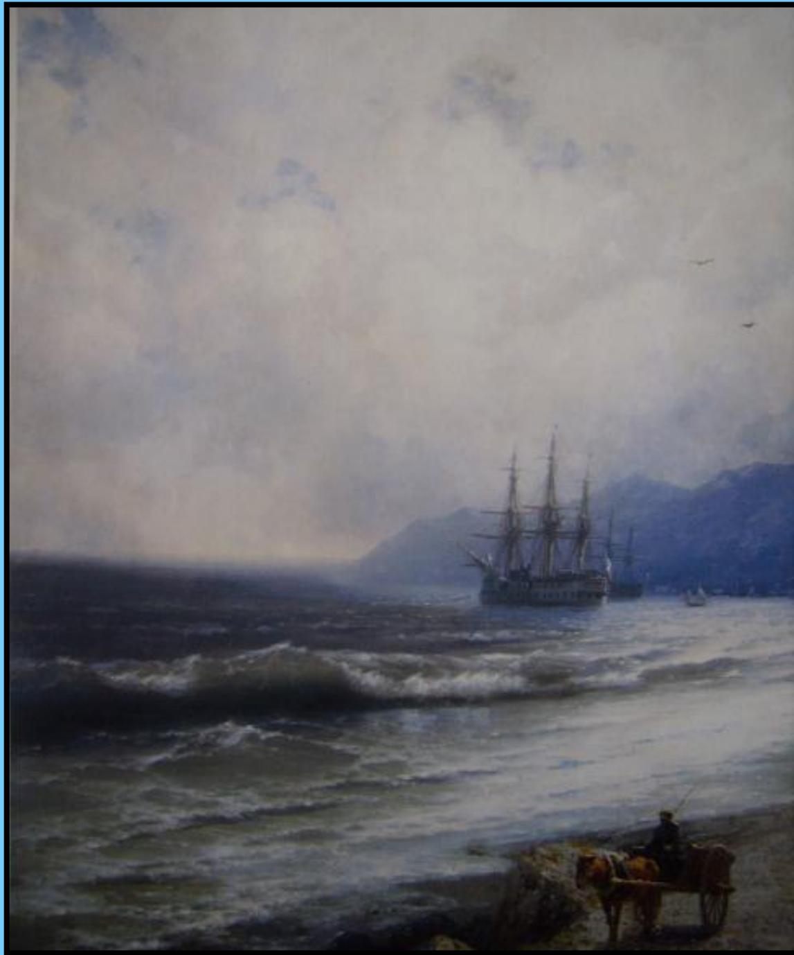
И.К. Айвазовский «Прилив»