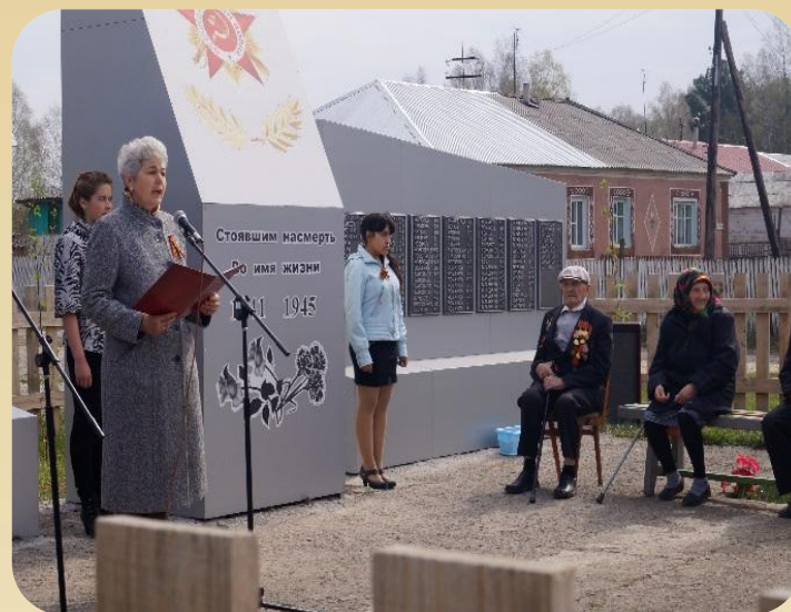
Митинг, посвященный Великой Победе 2014г, 69-я годовщина