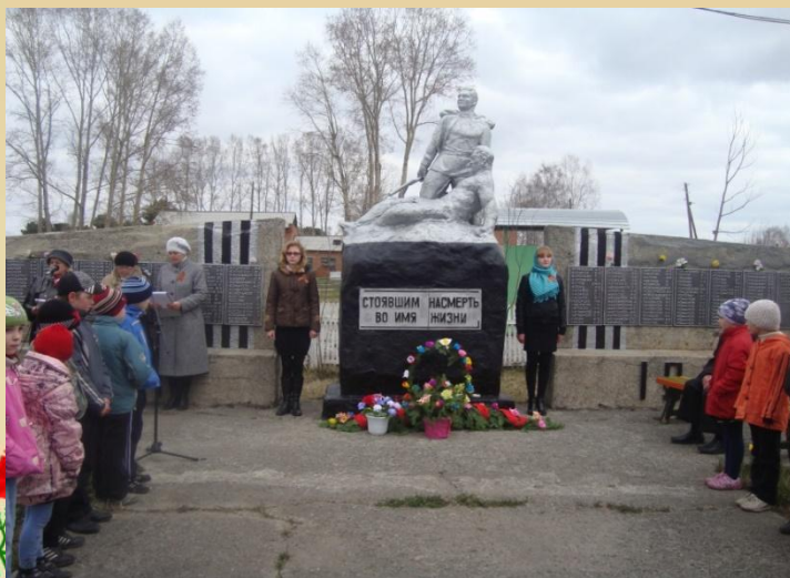
Митинг возле памятника в с. Красноселка 2012г

Мой старший брат рассказал о том, что 9 мая весь российский народ празднует День Победы. В городах и деревнях проходят митинги, посвященные павшим солдатам в боях за Родину. В нашей деревне тоже есть свой обелиск, на нем размещены имена героев погибших, защищая родную страну. А в главном городе нашей страны – столице проходит торжественный парад войск, посвященный Дню Победы. Празднование завершается салютом, который освещает каждый уголок мирного неба нашей Родины.