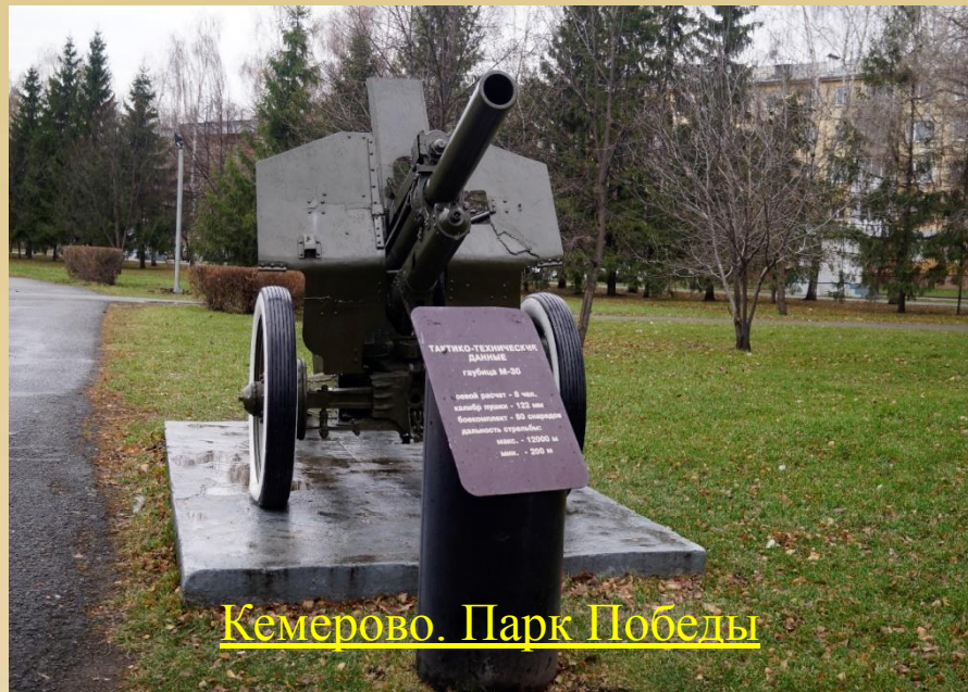
Кемерово. Парк Победы

Папа предложил мне рассказать о фронтовом оружии, которое использовали на войне. И я не только узнала что такое «Катюша», но и увидела пушку «Гаубицу». Сейчас военную технику тех лет мы можем увидеть только в парках посвященных Великой Отечественной Войне, такие парки есть в каждом городе.