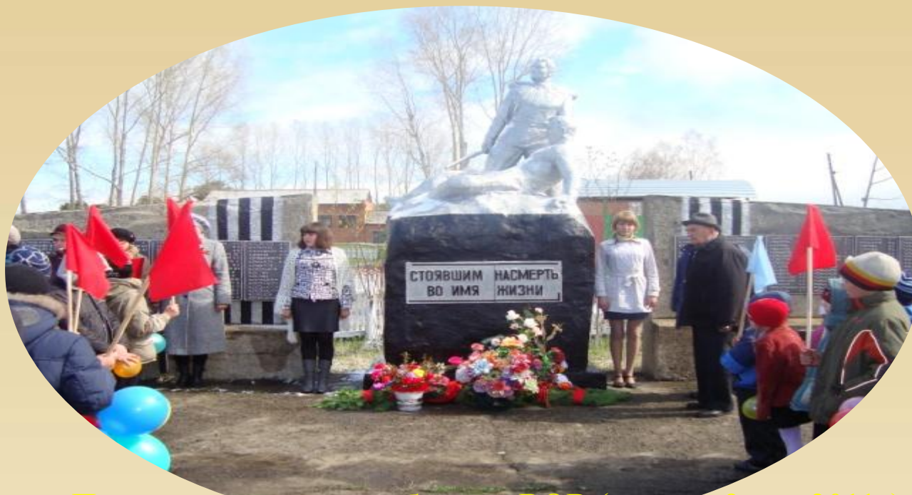
Памятник героям погибшим в ВОВ (митинг 9 мая 2011г)