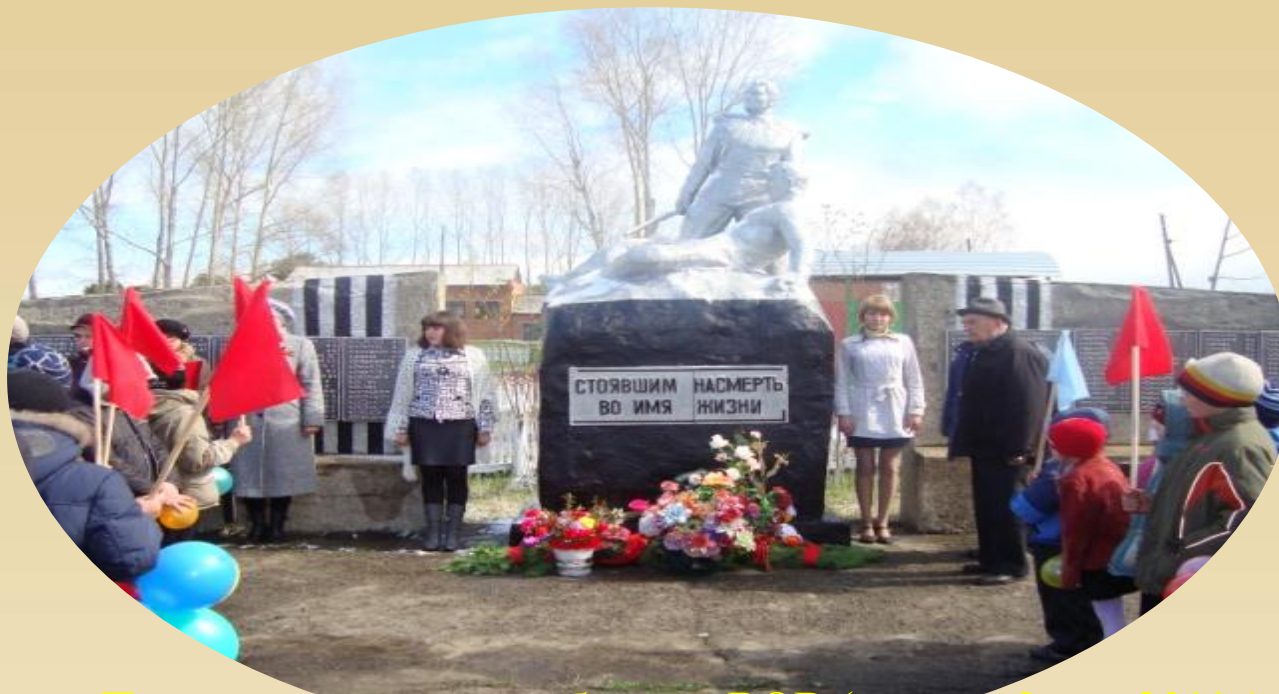
Памятник героям погибшим в ВОВ (митинг 9 мая 2011г)