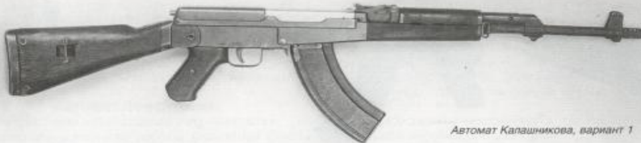
Автомат Калашникова, вариант 1