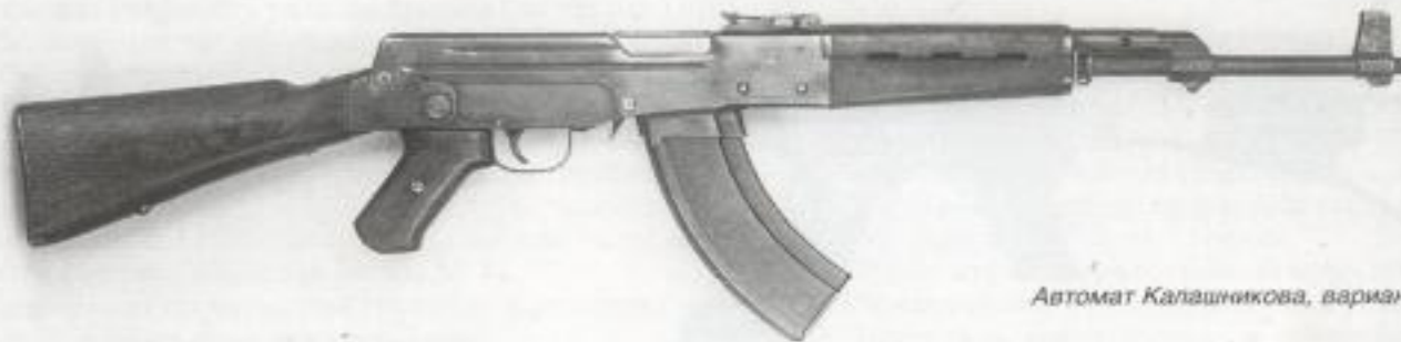
Автомат Калашникова, вариант 2

В 1947 году автомат Калашникова побеждает в конкурсе и принимается на вооружение.