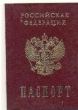
Паспорт гражданина РФ

• На печатях федеральных органов государственной власти, иных государственных органов, организаций и учреждений, официальных представительств России за рубежом.