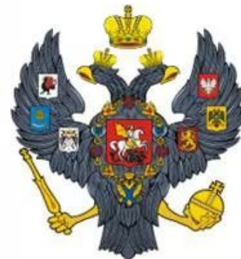
Герб России, 1830 год