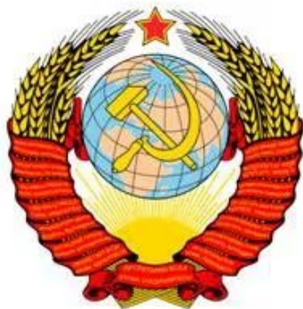
Герб Советского Союза