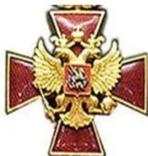
Знак Президента России

• На печатях федеральных органов государственной власти, иных государственных органов, организаций и учреждений, официальных представительств России за рубежом.