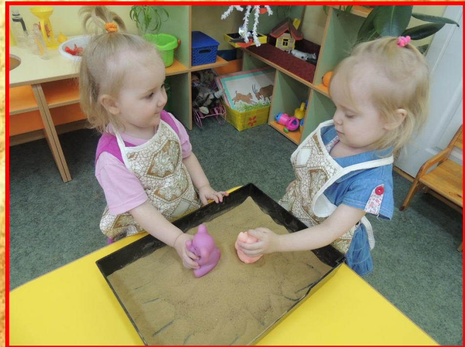
«Игрушки катаются с горки»