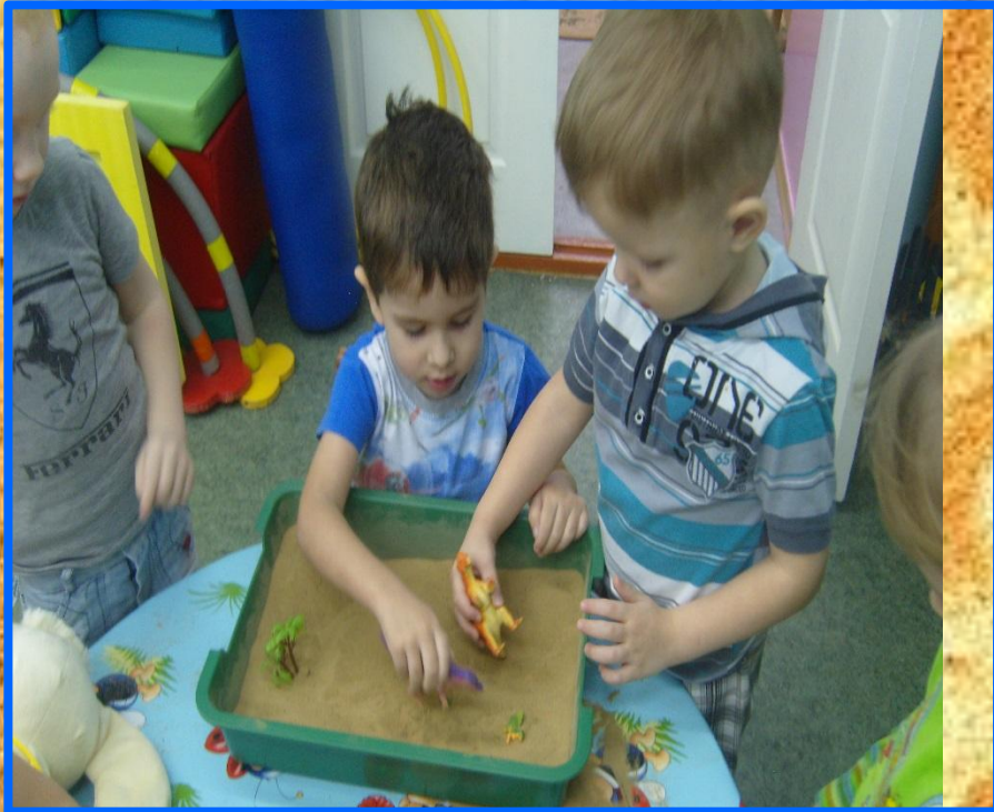
«Норки для зверюшек»