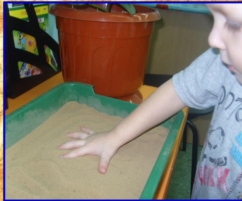
«Отпечатки наших рук»