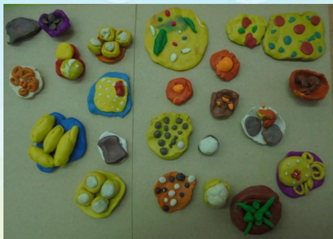
Лепка «Хлебобулочные изделия»