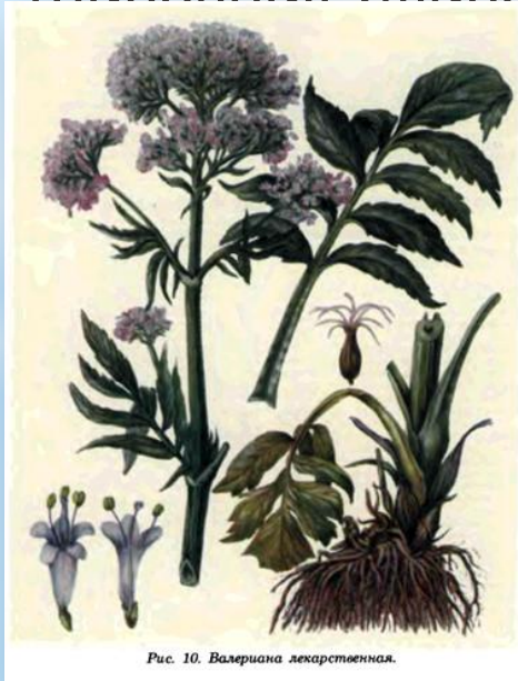
Рис. 10. Валериана лекарственная.