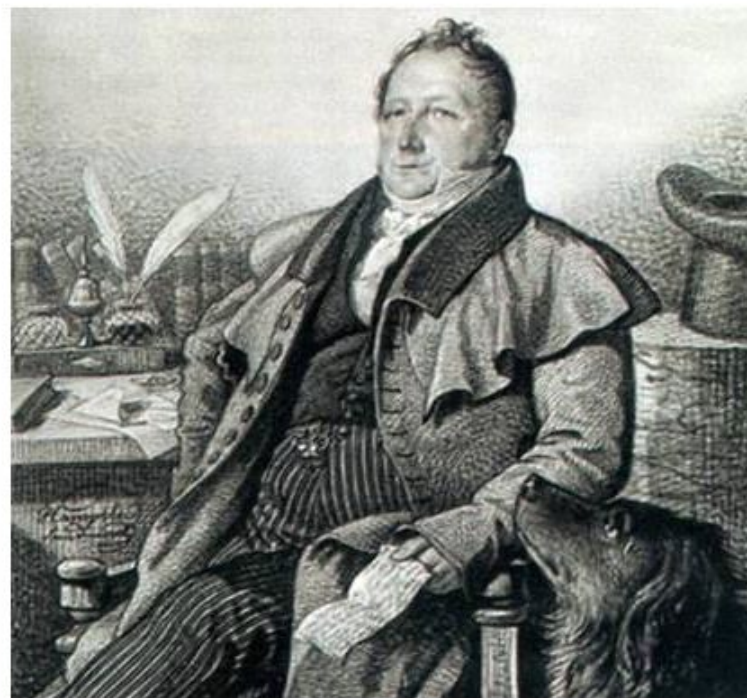
Сергей Львович Пушкин (1770-1848), отец поэта.

Отец поэта, Сергей Львович Пушкин. Отставной военный, был старинного рода, ноне богат и не слишком удачлив в службе и чинах.