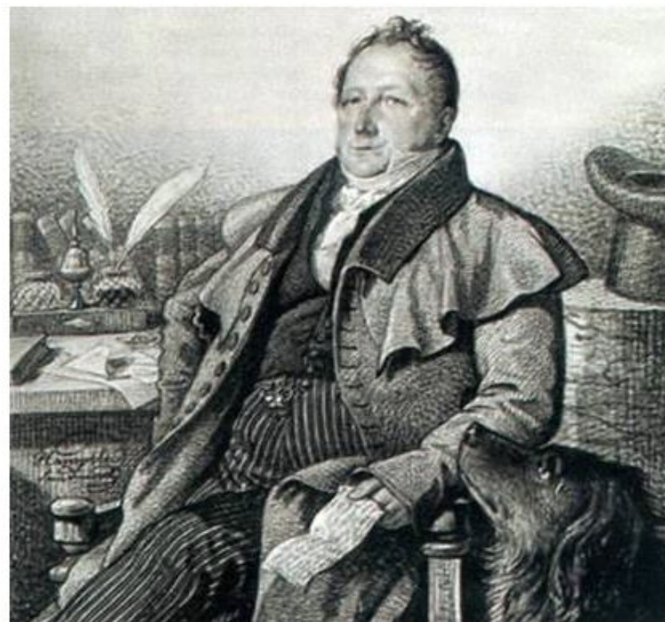
Сергей Львович Пушкин (1770-1848), отец поэта. Неизв. художник. 1810-е гг.

Отец поэта, Сергей Львович Пушкин. Отставной военный, был старинного рода, ноне богат и не слишком удачлив в службе и чинах.