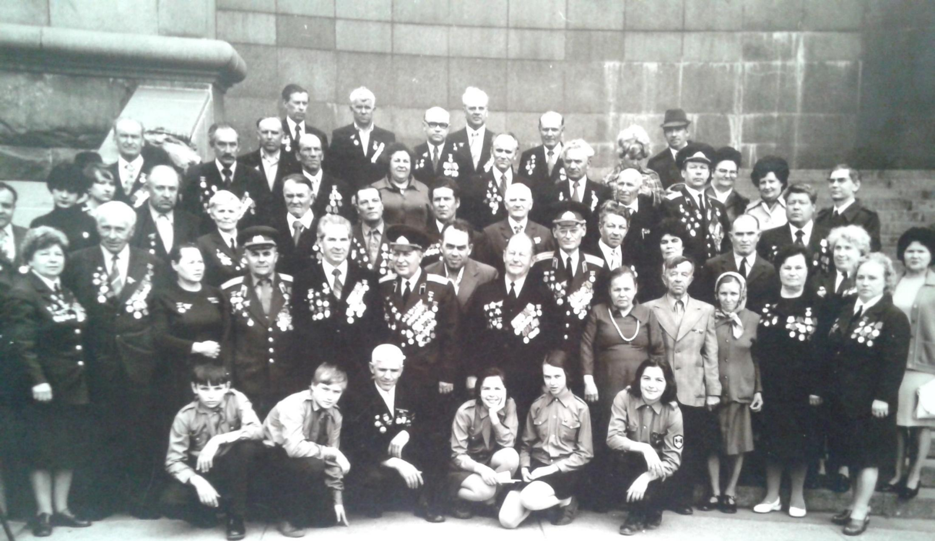
29 гвардейская истребительная Уланская ордена Ленина Краснознаменная орденов Суворова, Кутузова, Богдана Хмельницкого и Александра Невского бригада Москва 5-10 мая 1978 г.