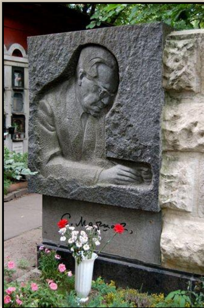
Памятник на могиле С.Я. Маршака

С. Я. Маршак скончался 4 июля 1964 года в