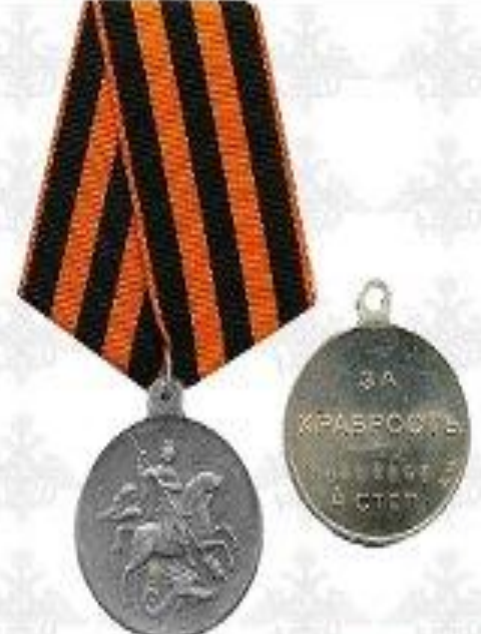
Отечественная война I степени с Звездой (Время правления)