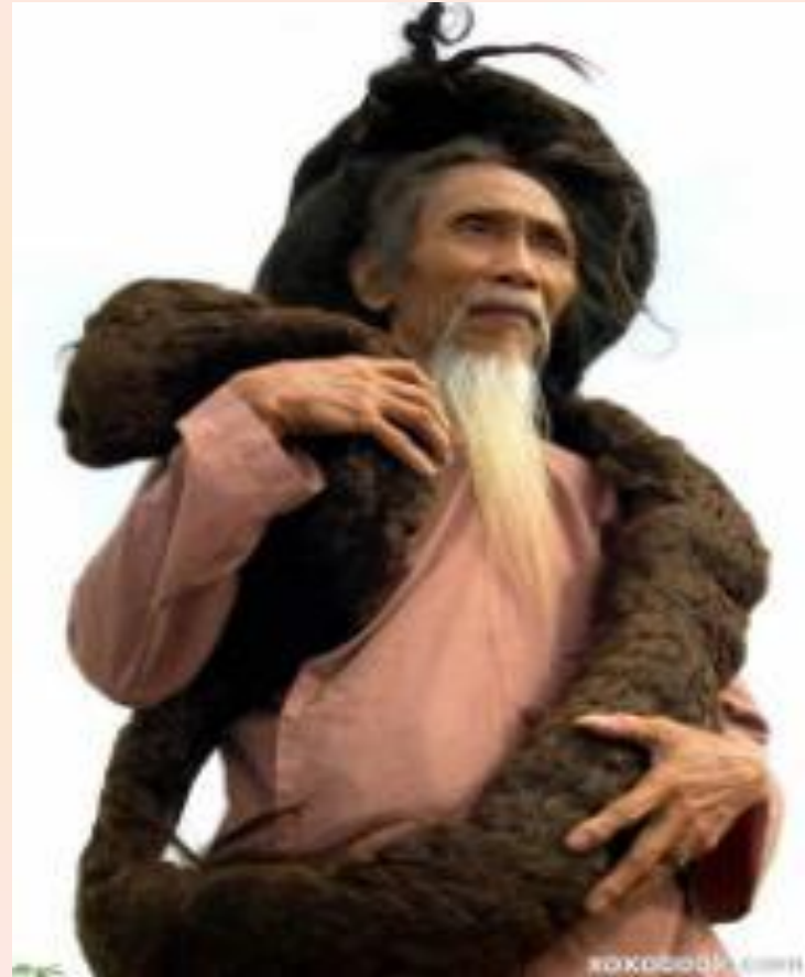
Самые длинные волосы в мире