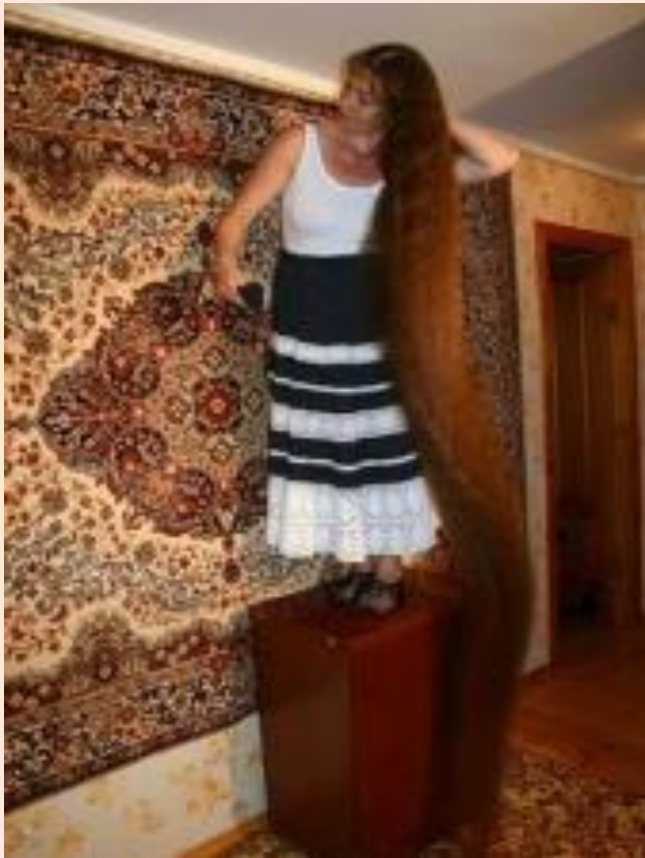
Самые длинные волосы в России