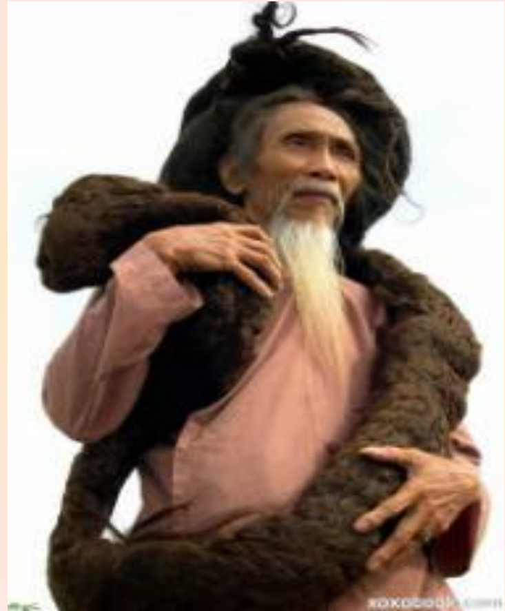
Самые длинные волосы в мире