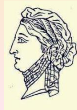
XII век Франция