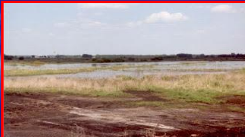
Последствия гидромелиорации на примере торфяного болота (А.Пахомов)