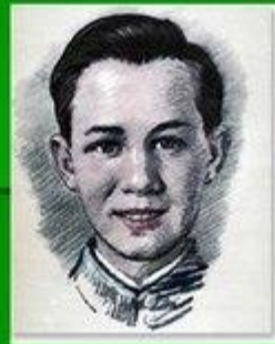
Боря Цариков Герой Советского Союза