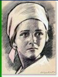
Надя Богданова Награждена орденом Боевого Красного Знамени