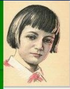
Люся Герасименко пионер-герой