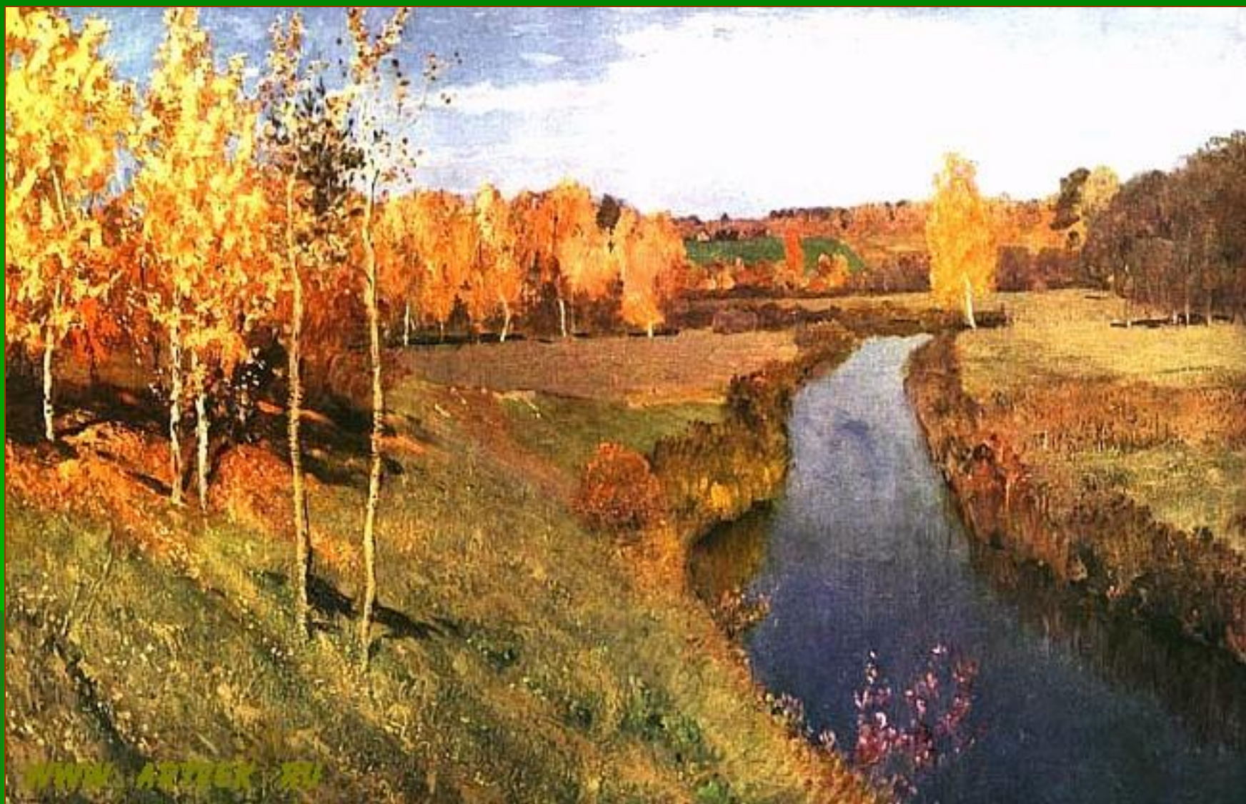
И. И. Левитан. Золотая осень.