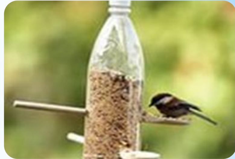
Кормушки из пластиковых бутылок