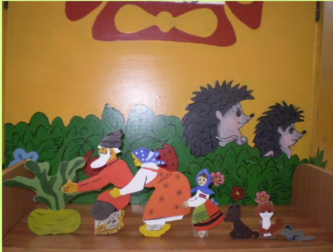
Настольный театр «Репка»