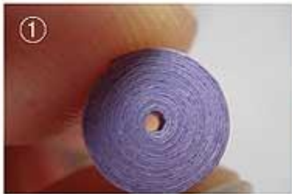
СХЕМА ИЗГОТОВЛЕНИЯ ОСНОВНОЙ КВИЛЛИНГОВОЙ ФОРМЫ