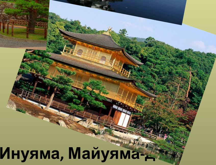
Замки: Фусими, Нидзё, Мацуэ, Инуяма, Майюяма-д