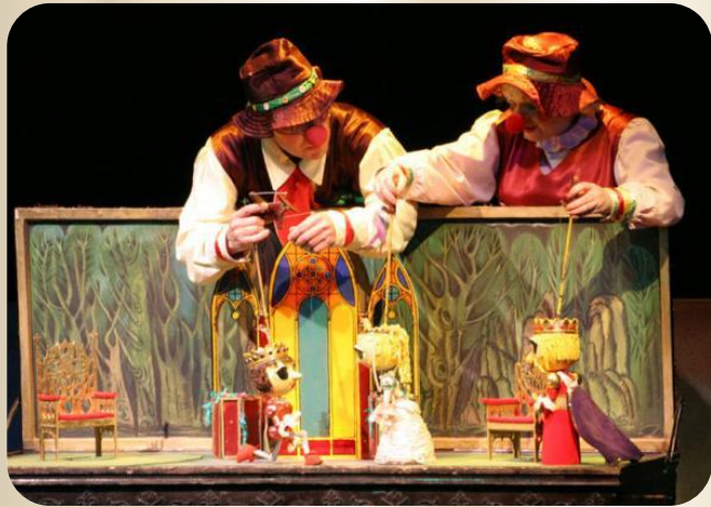
театр низовых кукол