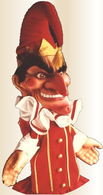
В Италии - Пульчинелла