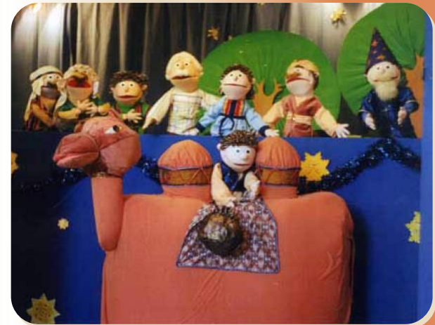
театр верховых кукол