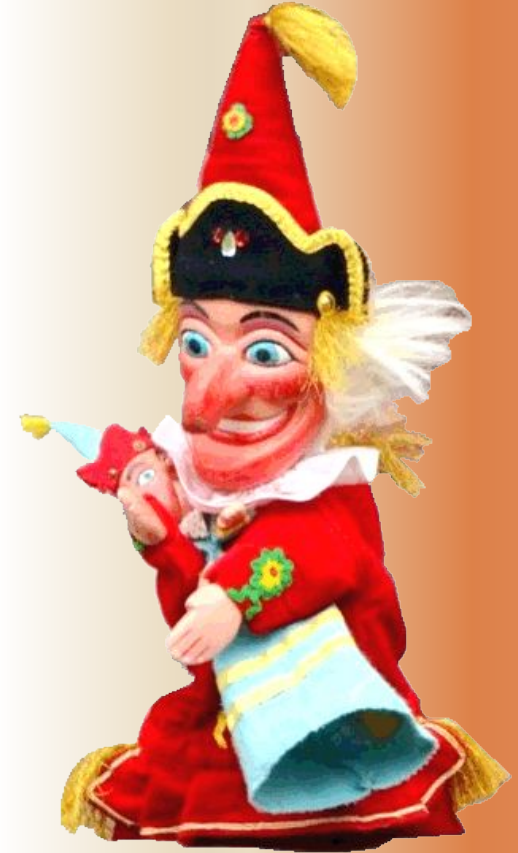
В Англии - Панч