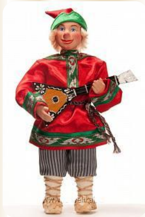
В России - Петрушка