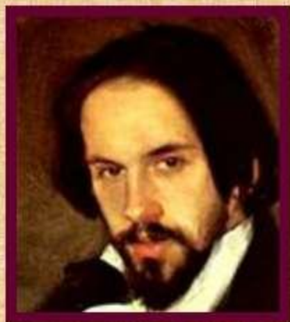
Билибин Иван Яковлевич (1876-1942г. г.)