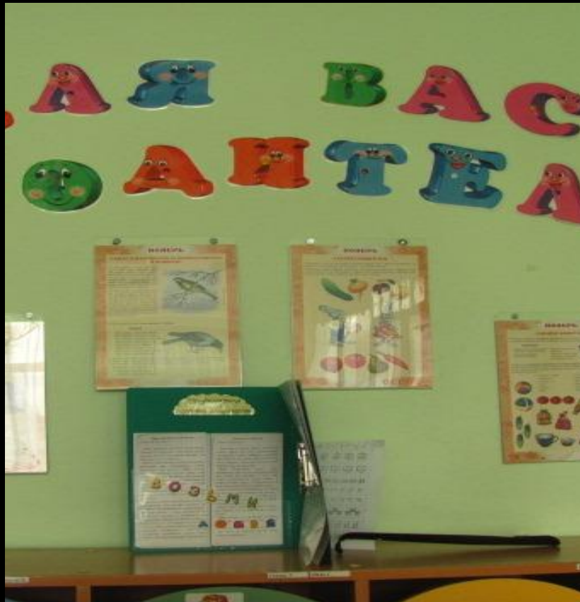
Среда для диалога с родителями (информационный центр)