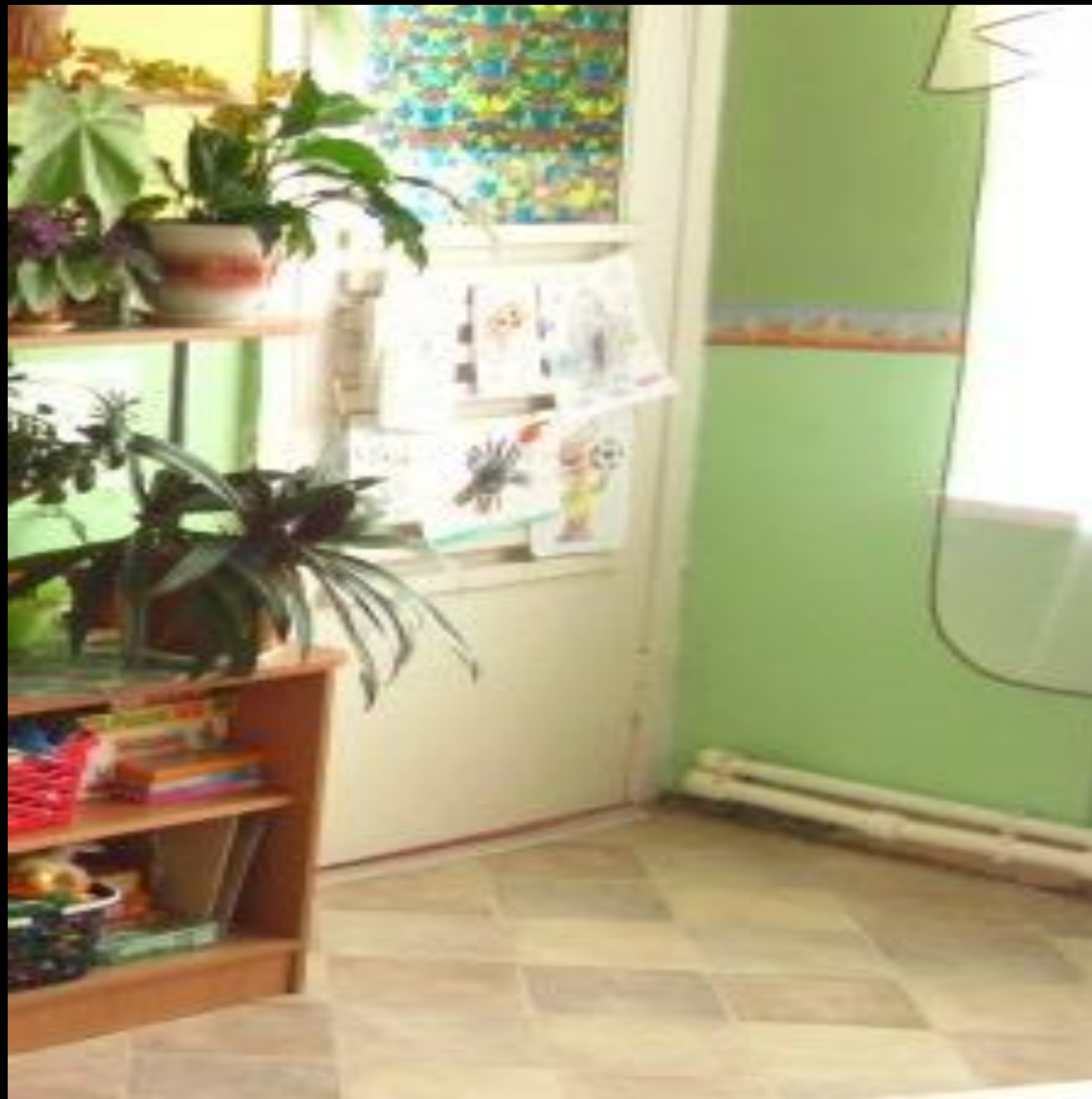
Демонстрации личных достижений.