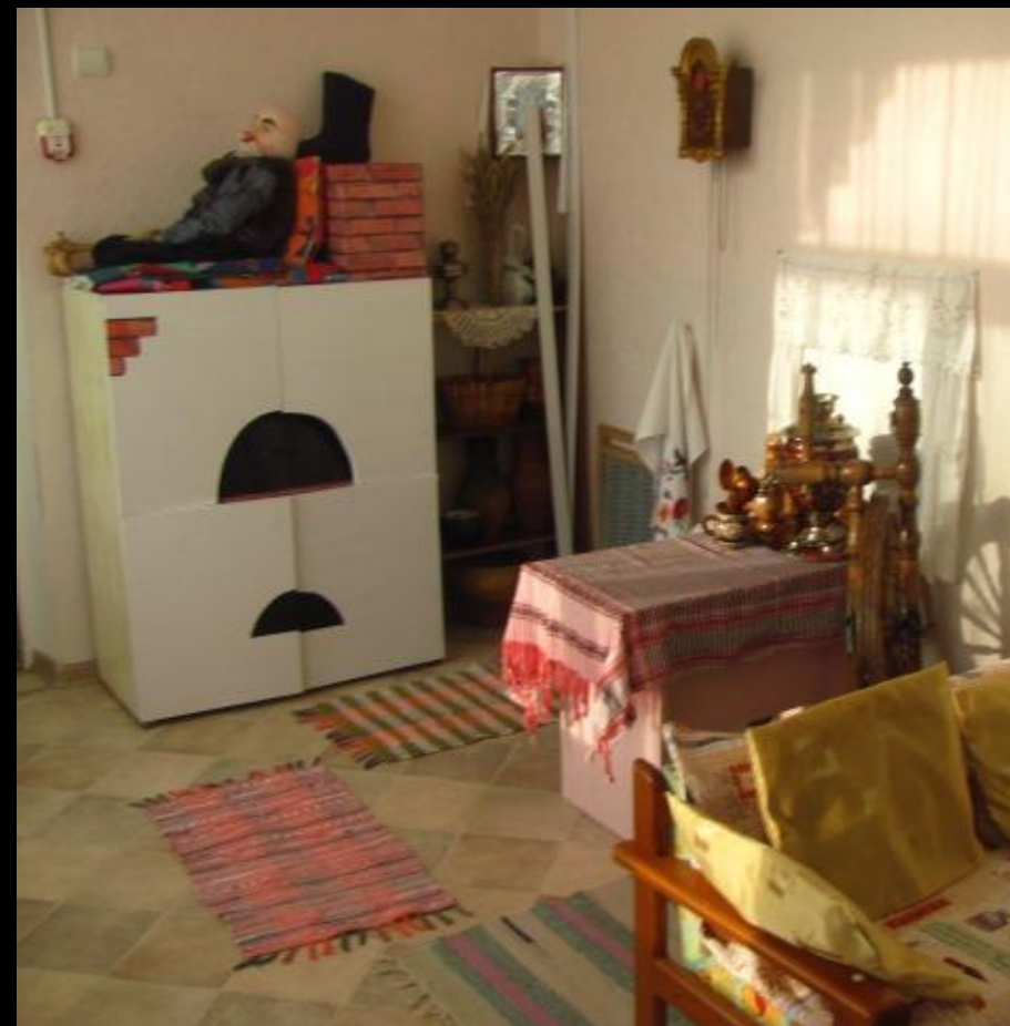
Центр активности «Русская изба»