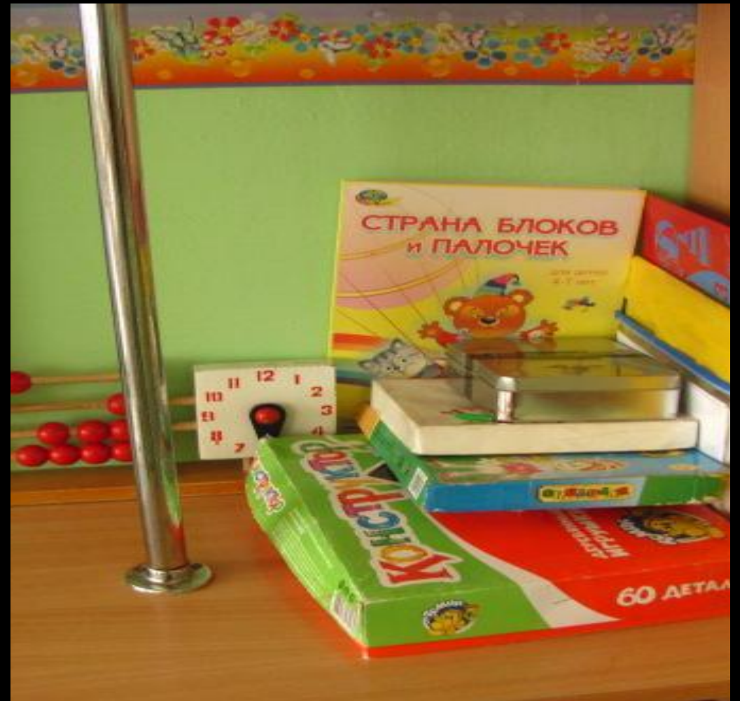
Модуль «Математическое развитие» представлен материалами для изучения счёта, формы, величины. Материалы по математическому развитию находятся в учебном секторе, секторе сенсорного развития и конструирования