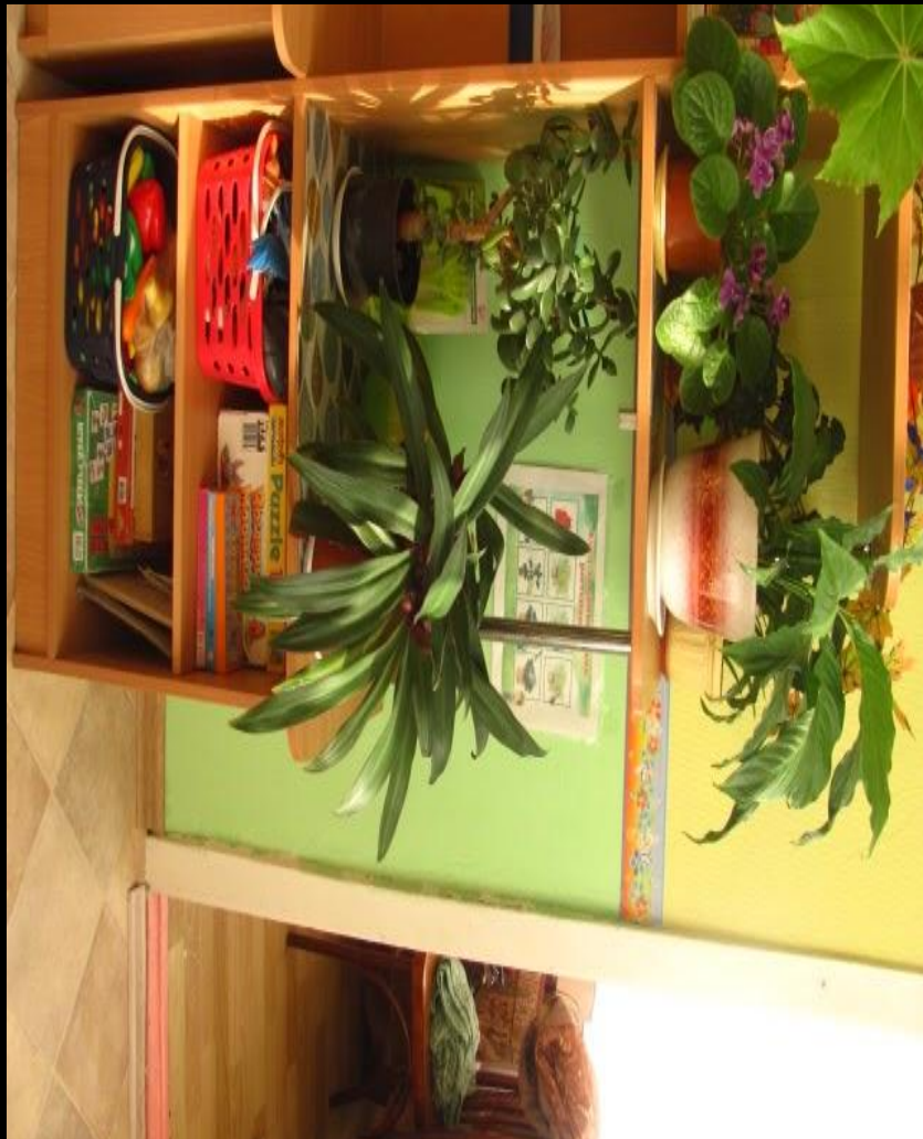
Модуль «Живая и неживая природа»