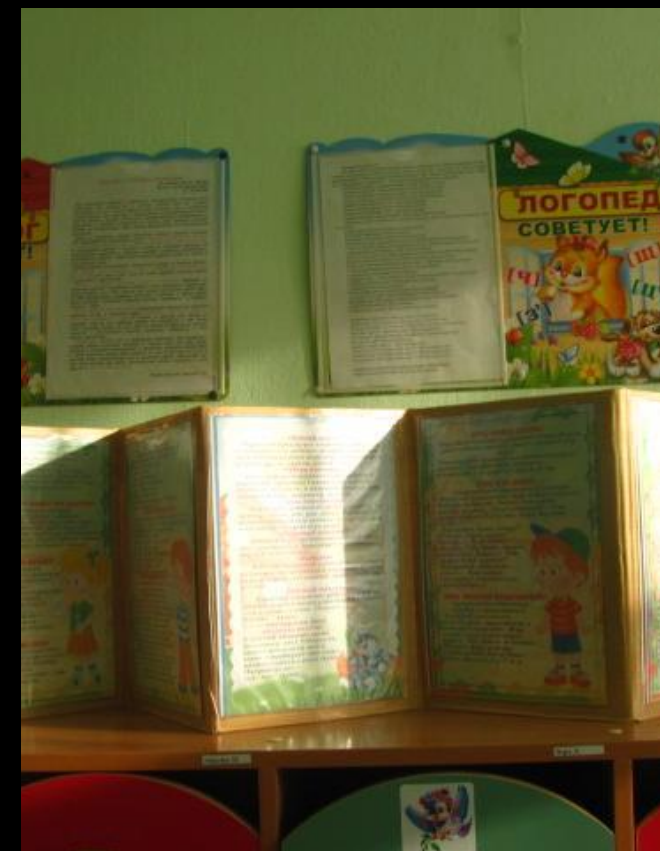
Среда для диалога с родителями (консультационный центр и практический центр)