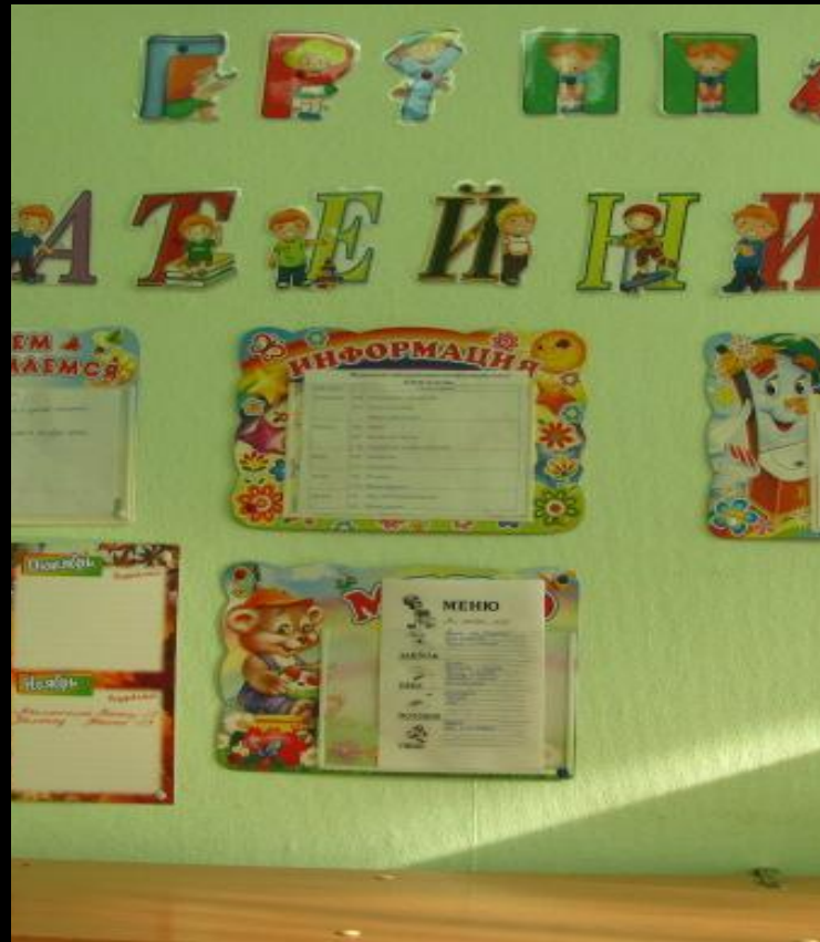
Среда для диалога с родителями (консультационный центр)