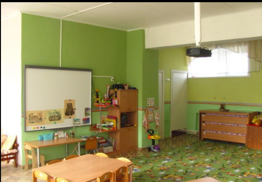
Нижняя левая точка