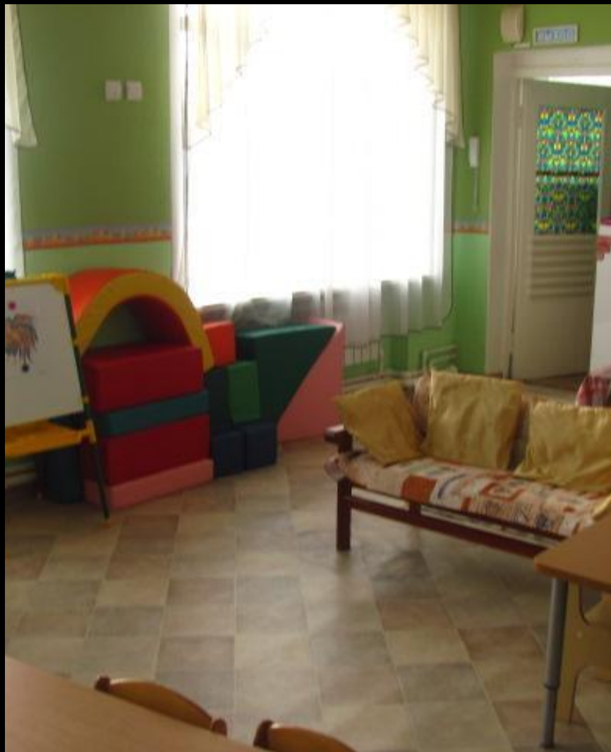
Вид из центра группы на вход в помещение