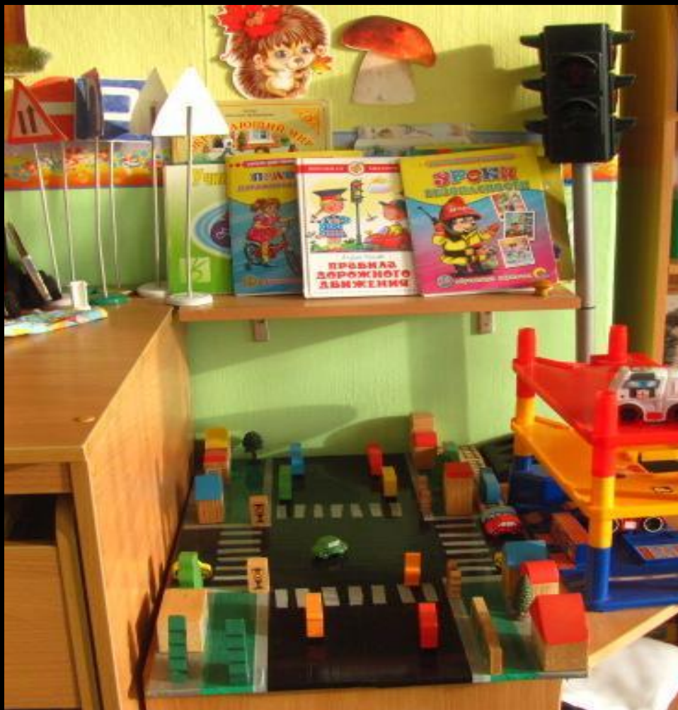
Активный сектор (дорожное движение) варьируется в зависимости от тем