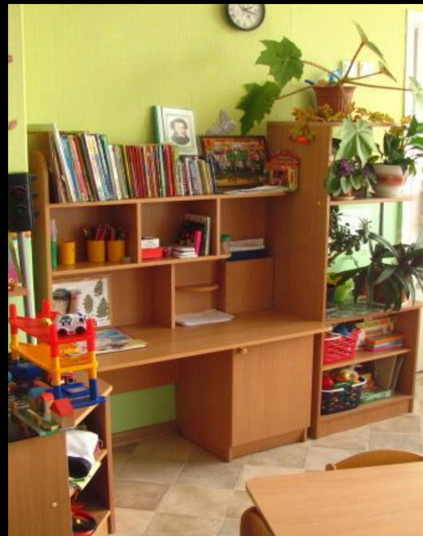
Вид из центра группы в противоположном входу направлении