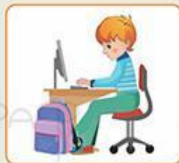
Посадка за компютером