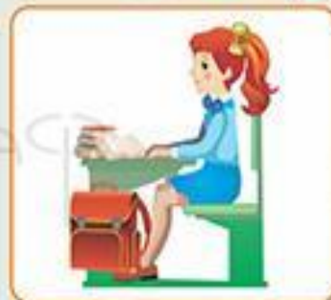
Посадка «Готов к работе»