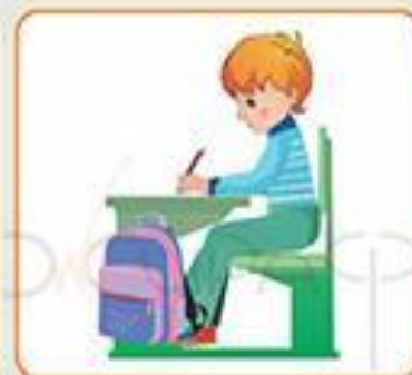
Посадка при писъме