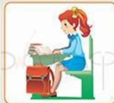
Посадка при чтении