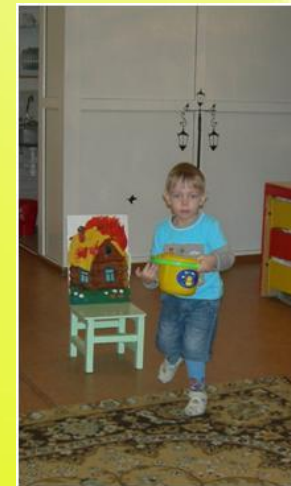
Соревнования «Ловкие пожарные»