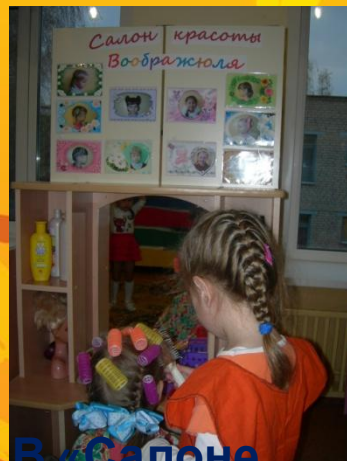
В «Салоне красоты»