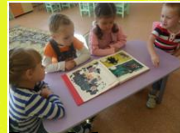
Тема «Ребенок и чужие люди»