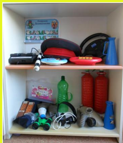
Сюжетно-ролевые игры «Юный