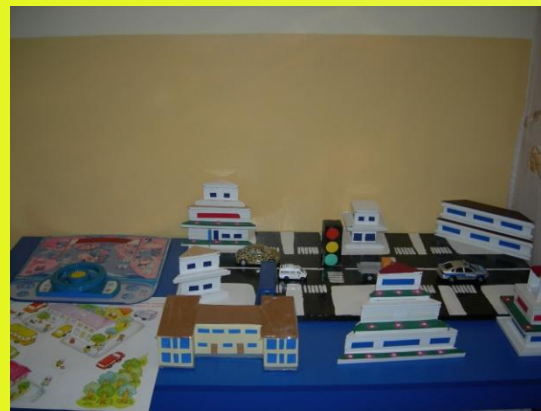
Макет ПДД «Перекресток»