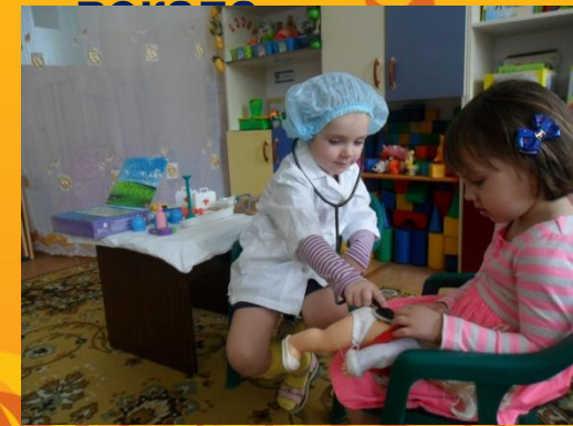
На приеме у доктора

В группе выделены центры организации определённого вида деятельности. Они не имеют чёткого разграничения, что позволяет соблюдать принцип полифункциональности, когда один и тот же игровой уголок по желанию можно легко и быстро преобразовать в другой.