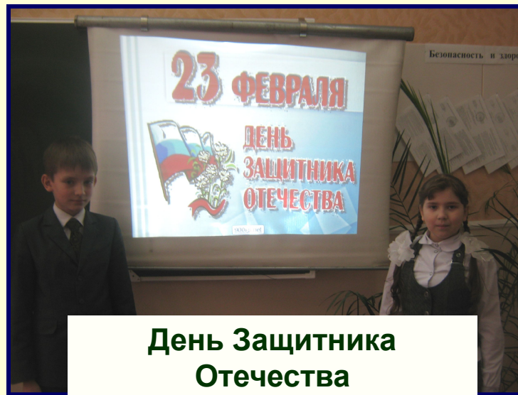
День Защитника Отечества