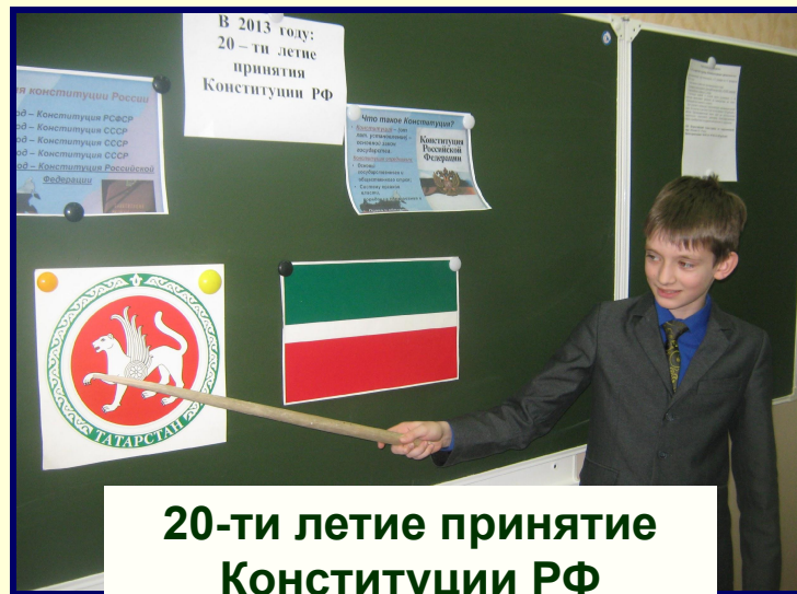
20-ти летие принятие Конституции РФ