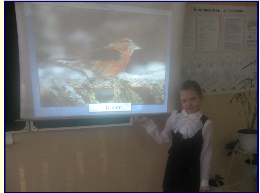
Конкурс чтецов «Наши пернатые друзья»