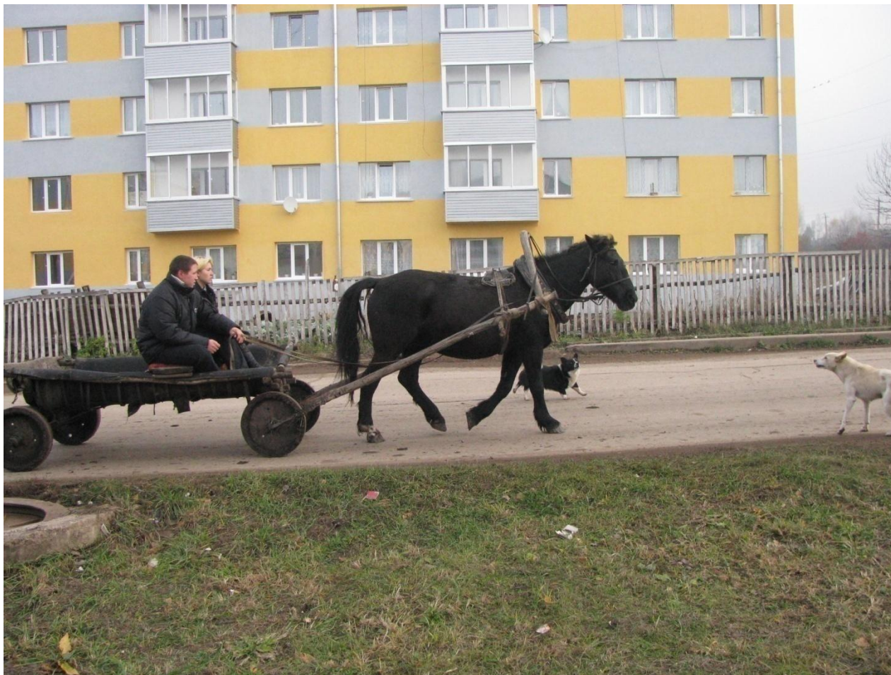
Населенный пункт –Клявлино.