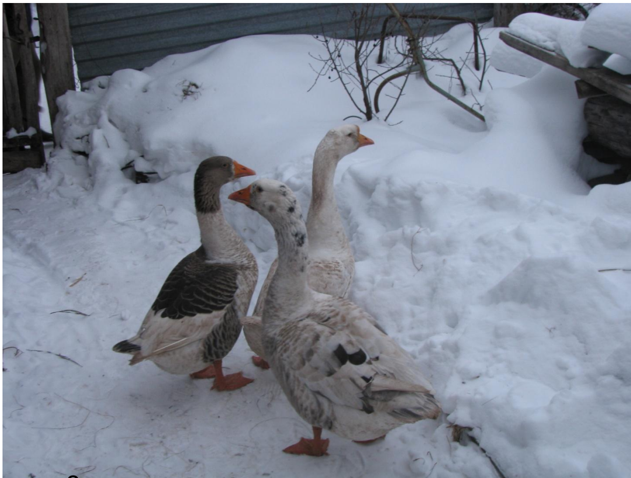
Зимнее содержание птиц