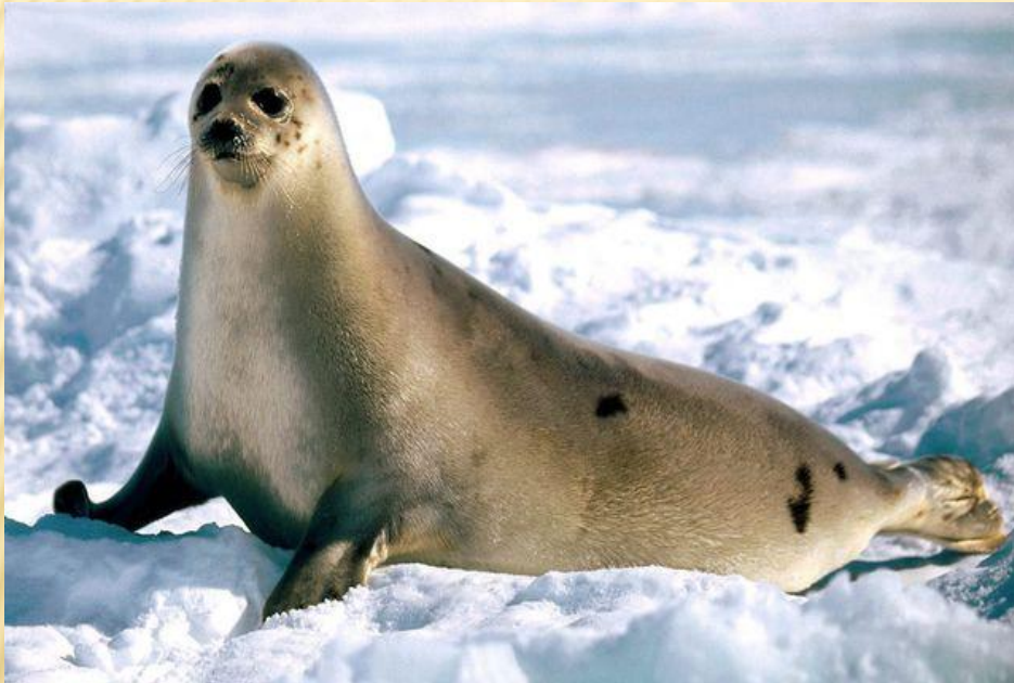
Представитель рода Тюленей-монахов, белобрюхий тюлень

Род Тюленей-монахов включает три вида: белобрюхий тюлень, Гавайский и карибский тюлень - монах, каждый из которых внесен в Красную книгу МСОП.