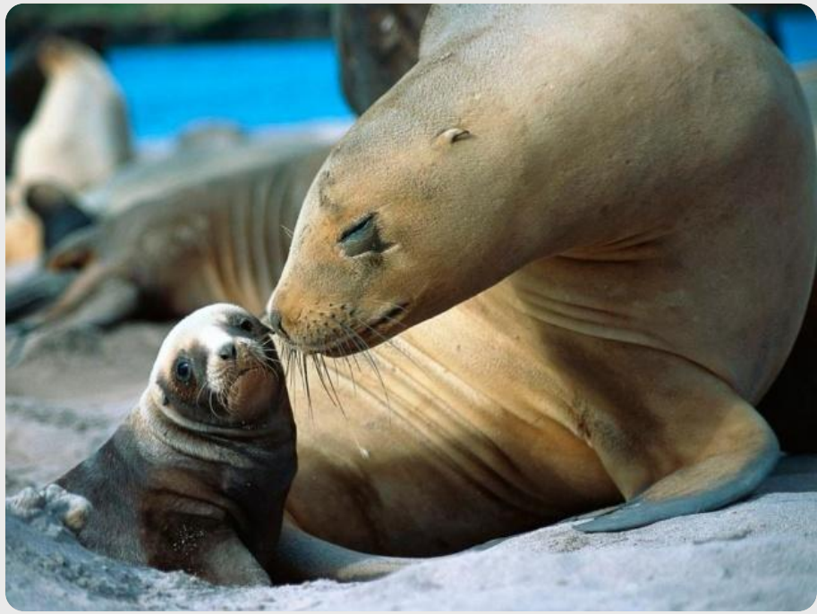
Ушастый тюлень ( Otariidae )