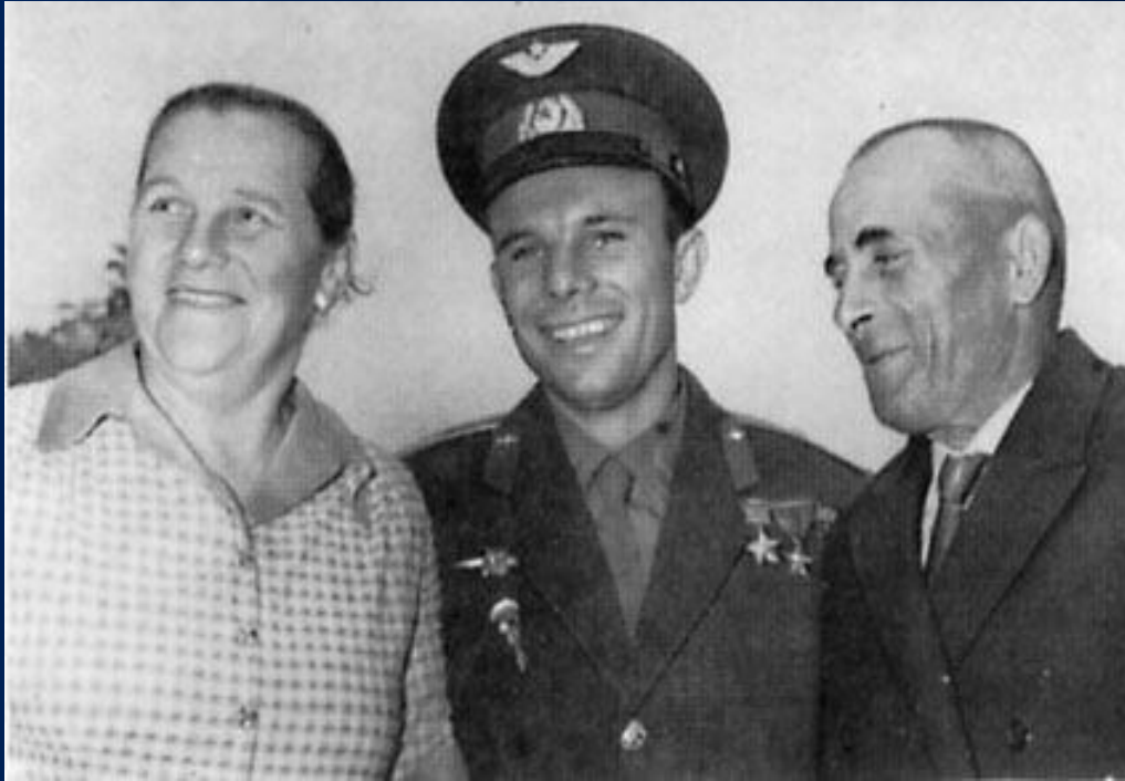
Гагарин с родителями