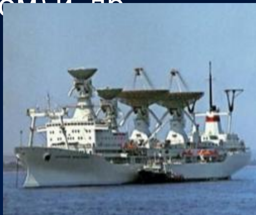
Научно-исследовательское судно «Юрий Гагарин»