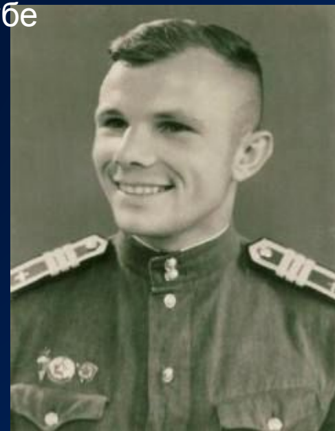
Ю.Гагарин в лётном училище