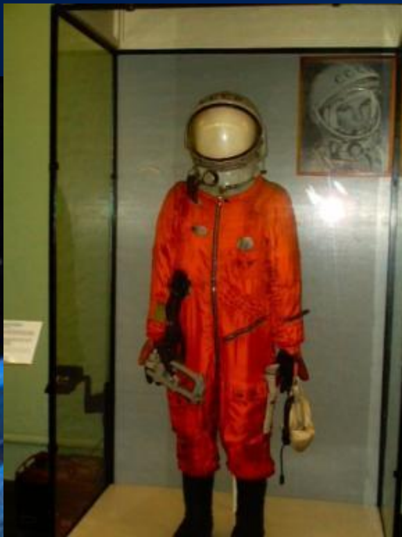
Скафандр Юрия Гагарина

Облетев Землю в корабле-спутнике, я увидел, как прекрасна наша планета. Люди, будем хранить и приумно- жать эту красоту, а не разру- шать её! — Гагарин —