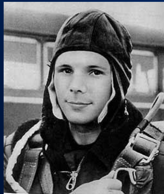
Ю.Гагарин в аэроклубе

В августе 1951 Гагарин поступает в Саратовский индустриальный техникум, и 25 октября 1954 года впервые пришёл в Саратовский аэроклуб. В 1955 году Юрий Гагарин добился значительных успехов, закончил с отличием учёбу и совершил первый самостоятельный полёт на самолёте Як-18. 27 октября 1951 года Гагарин был призван в армию и отправлен в Оренбург, в 1-е военно-авиационное училище лётчиков имени К. Е. Ворошилова. 25 октября 1957 Гагарин училище закончил.