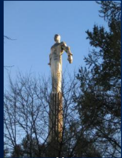
Памятники космонавту в Москве

Имя Юрия Гагарина носят: город Гагарин (бывший Гжатск), кратер на обратной стороне Луны, астероид № 1772, золотая медаль ФАИ (присуждается с 1968 года), площадь в Москве, где стоит памятник космонавту. Существует также Кубок Гагарина, главный трофей новообразованной Континентальной хоккейной лиги (Гагарин был большим хоккейным болельщиком) и др.