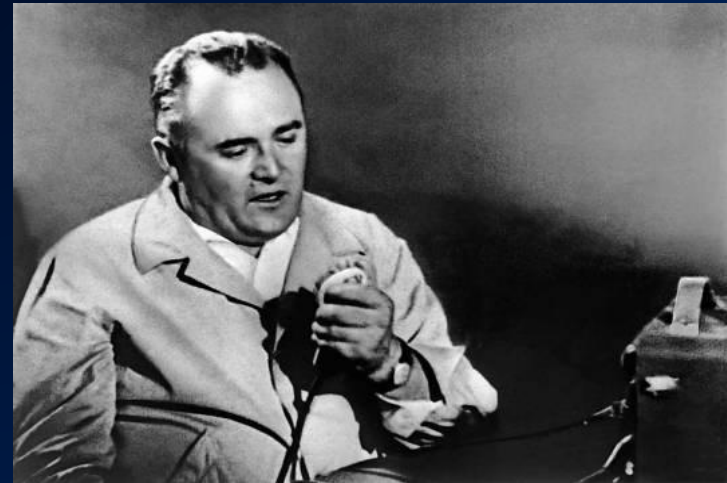
Сергей Королёв на связи с первым КОСМОНАВТОМ