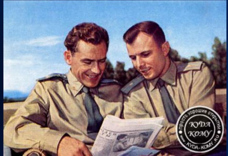
Юрий Гагарин и Герман Титов

Кроме Гагарина, были ещё претенденты на первый полёт в космос, всего было двадцать человек. Они были лучшими пилотами страны, претендентов отбирал сам Королёв. Из двадцати претендентов отобрали шестерых. Кто полетит в космос, определили в последний момент, ими стали Гагарин и его дублёр Герман Титов. Кандидатуру Гагарина определили за несколько часов до полёта. Герман Титов полетел в августе этого же года.