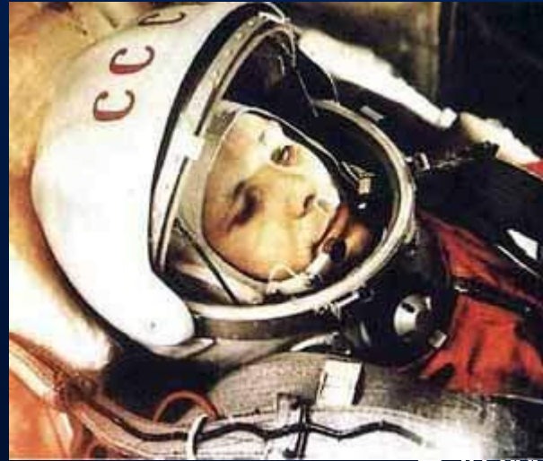
В КОМИЧЕСКОМ корабле

Выполнив один оборот вокруг Земли в 10:55:34 на 108 минуте, корабль завершил плановый полёт (на одну секунду раньше, чем было запланировано). Позывной Гагарина был «Кедр». Из-за сбоя в системе торможения спускаемый аппарат с Гагариным приземлился не в запланированной области в 110 км от Сталинграда, а в Саратовской области