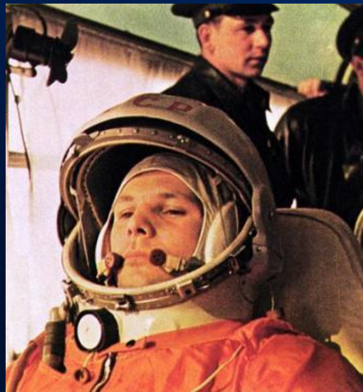
Юрий Гагарин перед полётом

Старт корабля «Восток» с Юрием Гагариным на борту