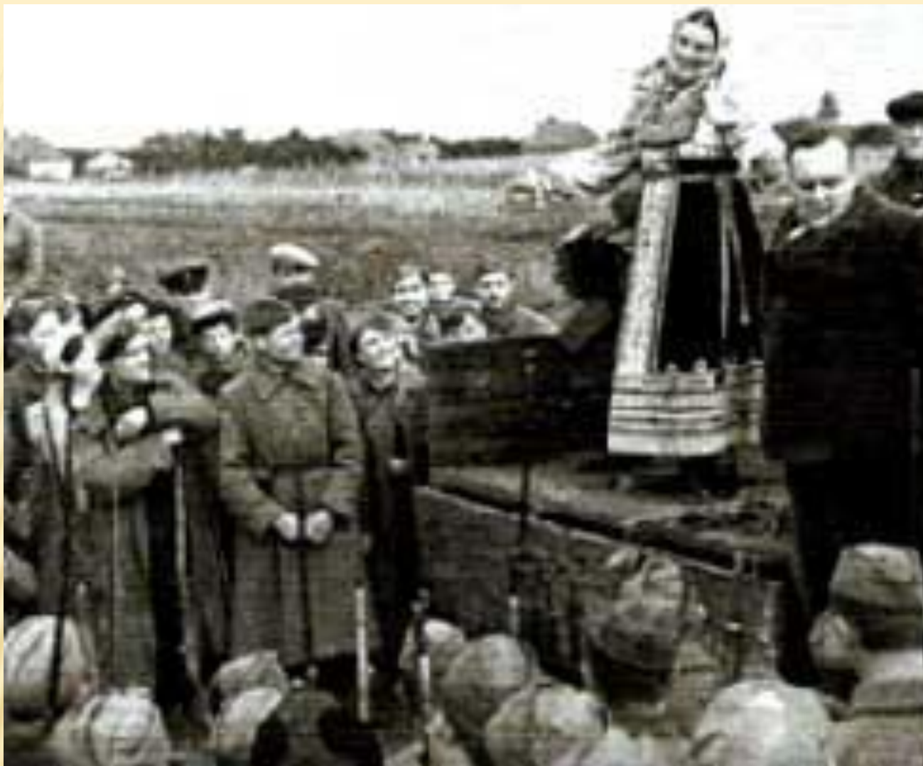
АРТИСТЫ НА ПЕРЕДОВОЙ