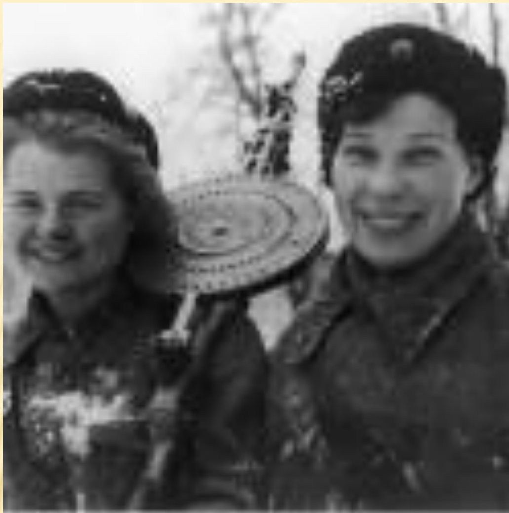
ДЕВУШКИ-ПУЛЕМЕТЧИЦЫ ИЗ ИСТРЕБИТЕЛЬНОГО БАТАЛЬОНА.