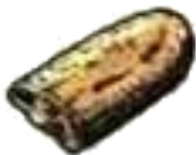
Медный слиток из Италии