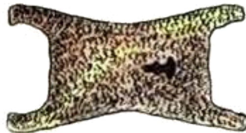
Бронзовый слиток из Микен