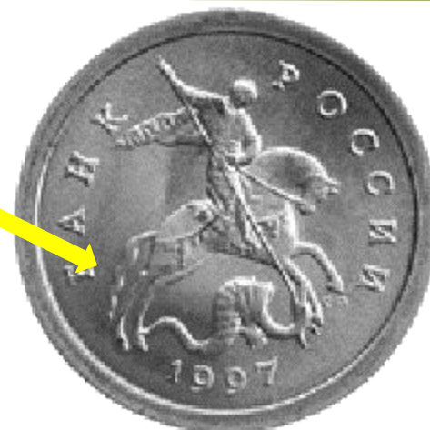
Аверс или «орёл»