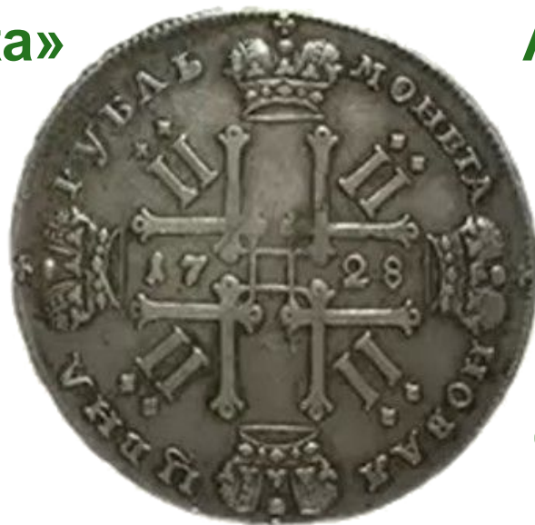
Серебряный рубль Петра I