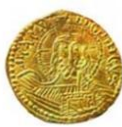
Серебряники и златники