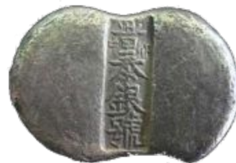
Серебряный лям из Китая