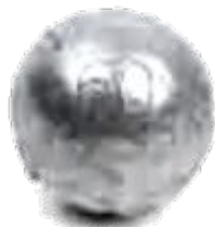
Свинцовый шарик из Северной Америки