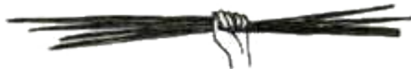
Железные прутья из Греции. По-гречески «горсть» - драхма.