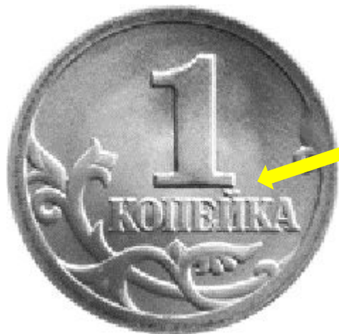
Реверс или «решка»