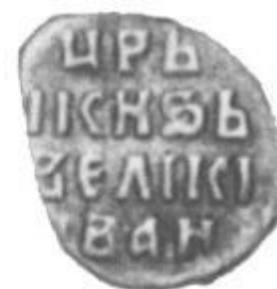
Копейные деньги 1534 года