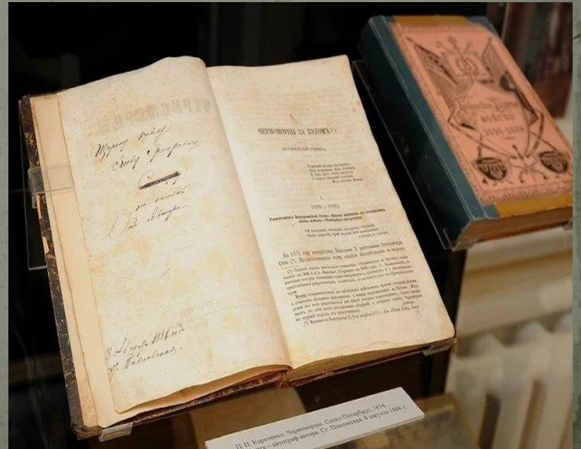
П. П. Копорин. Мемориал. Сана Погода. 1814. Служба: церковно-славянск. Сл. Погода. 1814.