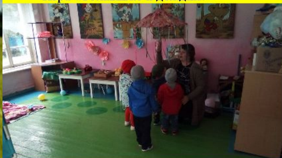
Игра «По узенькой дорожке»