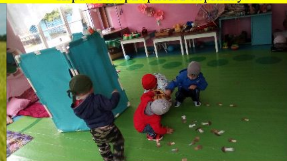
Встреча мамы зайчихи с сыночком.