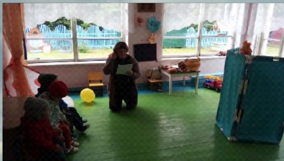
Игра «Солнышко и дождик»

В конце развлечения дети нашли зайчихи сыночка, а она их отблагодарила, угостила морковкой.