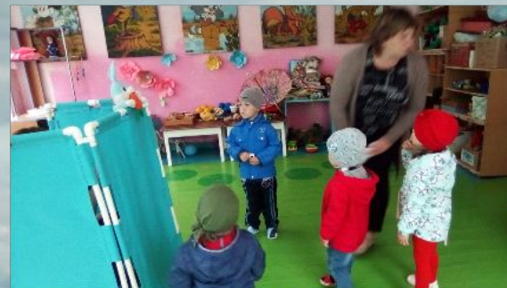
Игра «Собери грибы в корзинку»