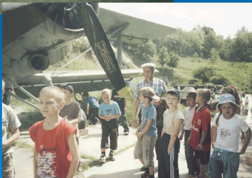
Музей военной техники в г.Аксае