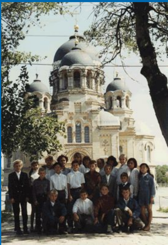
Новочеркасск. Столица казачьего Дона.