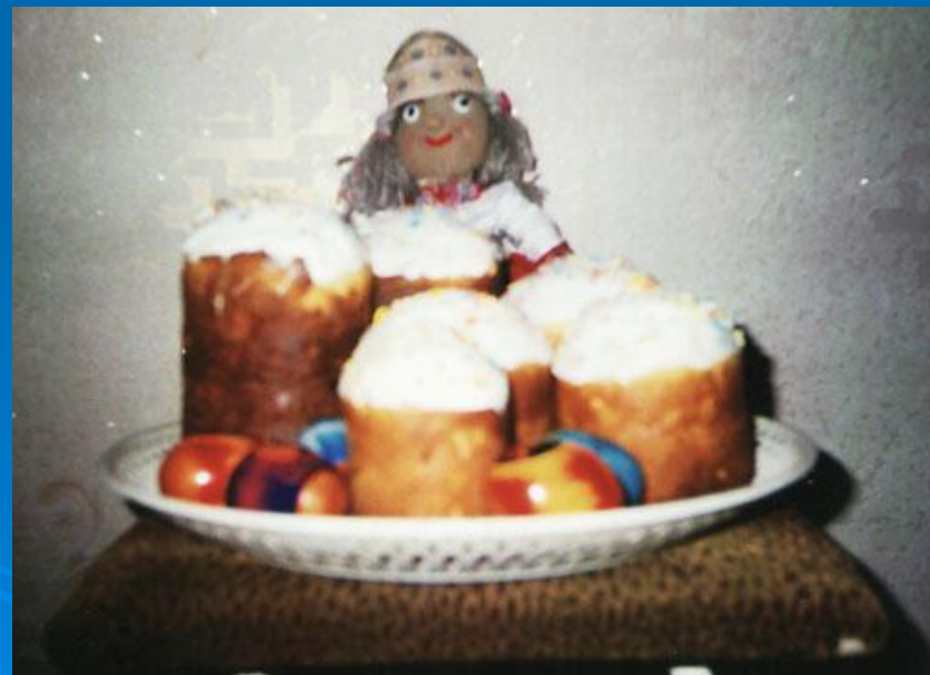
Пасха – праздничное угощение