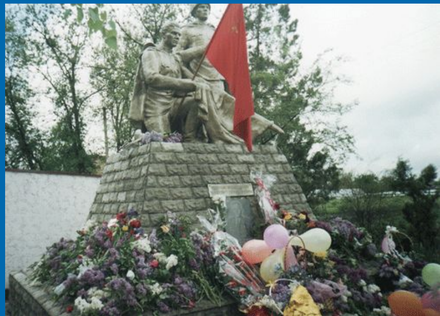
Могила неизвестного солдата в ст.Ольгинской