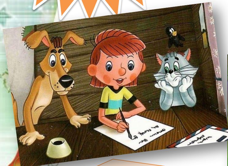
«Трое из Простоквашино»