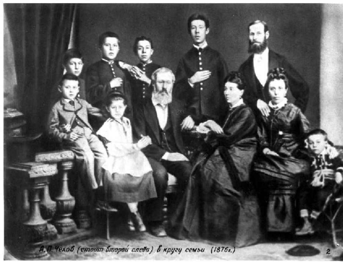
А. П. Чехов (стоит второй слева) в кругу семьи (1876г.)